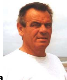
Grußwort zum Thema