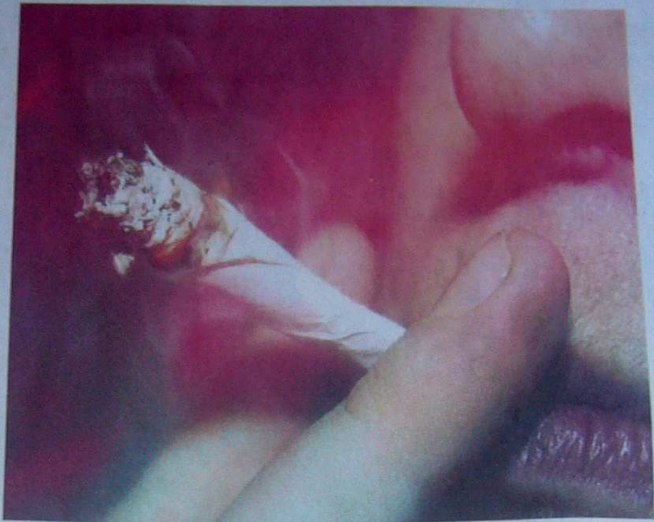
Wer mit Joint erwischt wird, muss mindestens mit Auflagen rechnen.

Zudem sei Marihuana deutlich gesundheitsschädlicher als früher eingeschätzt wurde – in Deutschland hätten schon 600 000 Erwachsene mit psychischen oder gesundheitlichen Störungen durch Haschisch-Konsum zu kämpfen.