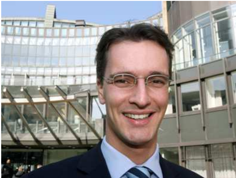
CDU-Generalsekretär Hendrik Wüst