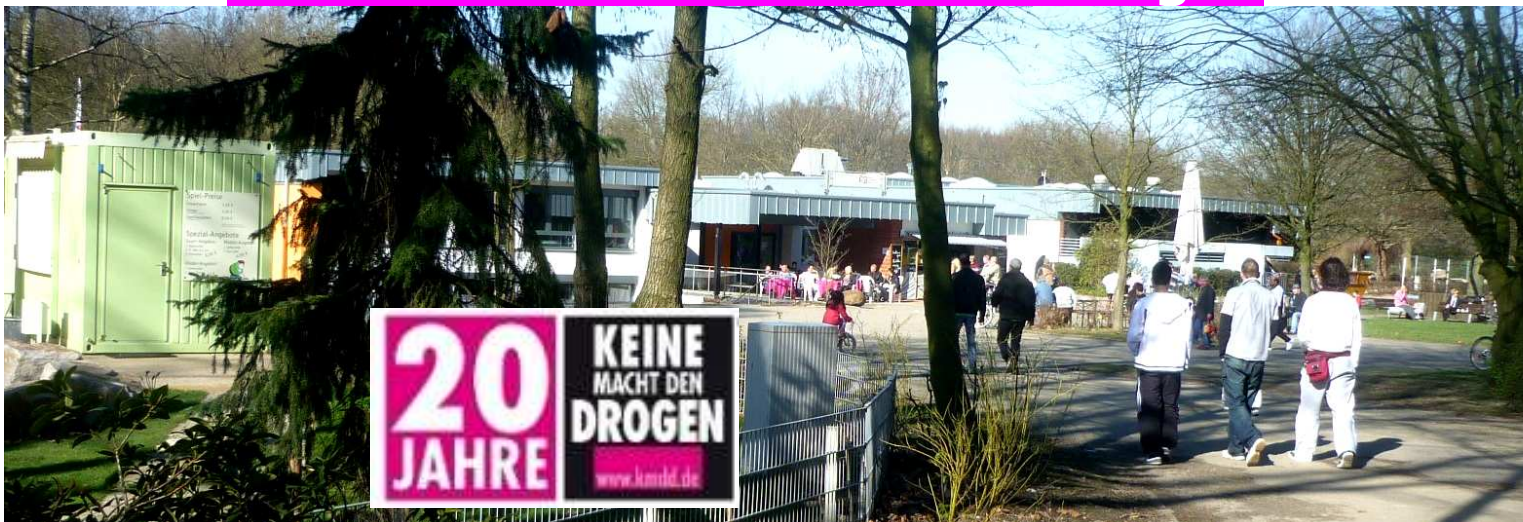
Der Startpunkt zum DFB-COOPER-LAUF im Gesundheitspark Nienhausen. Im Hintergrund das Therapiegebäude des Parks.