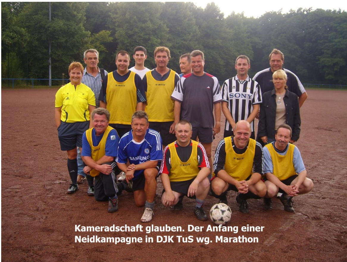
Kameradschaft glauben. Der Anfang einer Neidkampagne in DJK TuS wg. Marathon

LAUFEN • VON SPORTSIGGI AM HEUTE @ 11:52 AM Gelsenkirchen Laufen Eventtyp: Nicht klassifiziert • Strecken: → • Ausrüstung: Hinzufügen