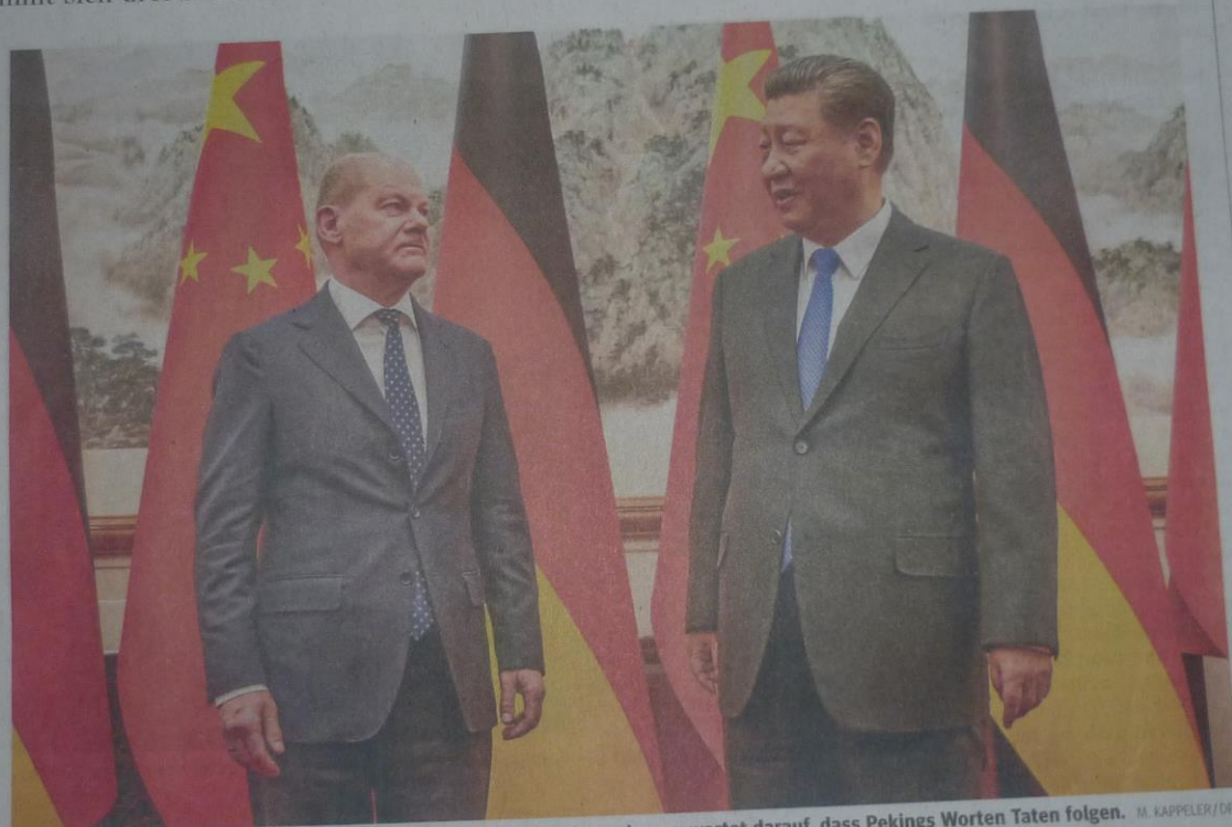
Kanzler Olaf Scholz (SPD, l.) und Staatschef Xi Jinping: Die Bundesregierung wartet darauf, dass Pekings Worten Taten folgen.

Während der Zeremonie sitzt Olaf Scholz vor deutschen und chinesischen Flaggen an einem schweren Tisch und schaut mit ernster Miene zu. Er hat einen langen Tag hinter sich, der im Staatsgästehaus Diaoyutai der chinesischen Regierung begann. Dort empfängt Staatspräsident Xi Jinping den deutschen Kanzler zunächst zum Gespräch mitsamt Beratern. Es folgen ein Austausch zu zweit bei einer Teezeremonie und ein Mittagessen im größeren Kreis. Solche ausführlichen Termine mit dem chinesischen Machthaber sind für westliche Politiker selten.