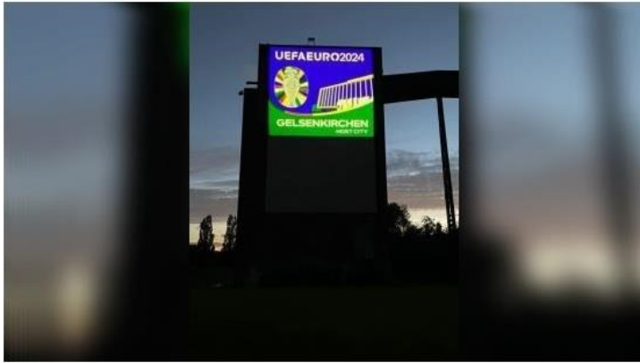
Das Host-City-Logo Gelsenkirchen am Kohlebunker im Nordsternpark.