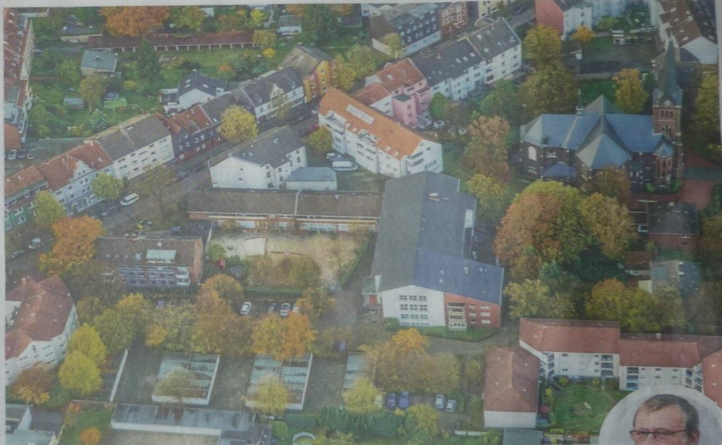
Die Emmaus-Kirchengemeinde besitzt an der Schonnebecker Straße und Steeler Straße viele Immobilien. Die sollen neu vermarktet werden – zum Nachteil der Kinder- und Jugendsozialarbeit?

Eine neuerliche Schiefelage befürchteten Fath und eine Reihe aktiver Mitglieder der Evangelischen Emmaus-Kirchengemeinde in Rotthausen, wenn die Jugendsozialarbeit im Quartier mangels Räumlichkeiten heruntergefahren wird. Bei der Sitzung der Bezirksvertretung Süd äußerte Fath, dass genau dieses Szenario