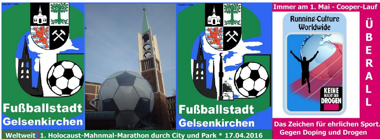
Weltweit 1. Holocaust-Mahnmal-Marathon durch City und Park * 17.04.2016 Das Logo einer Fußball- und Sportstadt im Wandel des Zeitgeistes. Sport ist die Brücke zur Verständigung aller Menschen - jeden Glaubens... "Sport verbindet alle Menschen! Gegen Lüge und Korruption in den Verbänden und der Politik - Sport gegen Hass und Ausländerfeindlichkeit - immer...!"

„Keiner hat soviel für den Fußball und den Schutz der Kinder in Deutschland und Gelenkirchen getan, wie Rolf Rüssmann mit Sepp Blatter und Franz Beckenbauer im WM Jahre 2004 – 2006. Schaun mer mal, was Phillip Lahm für ein bleibendes E M-Merkmal in Gelenkirchen setzen kann.