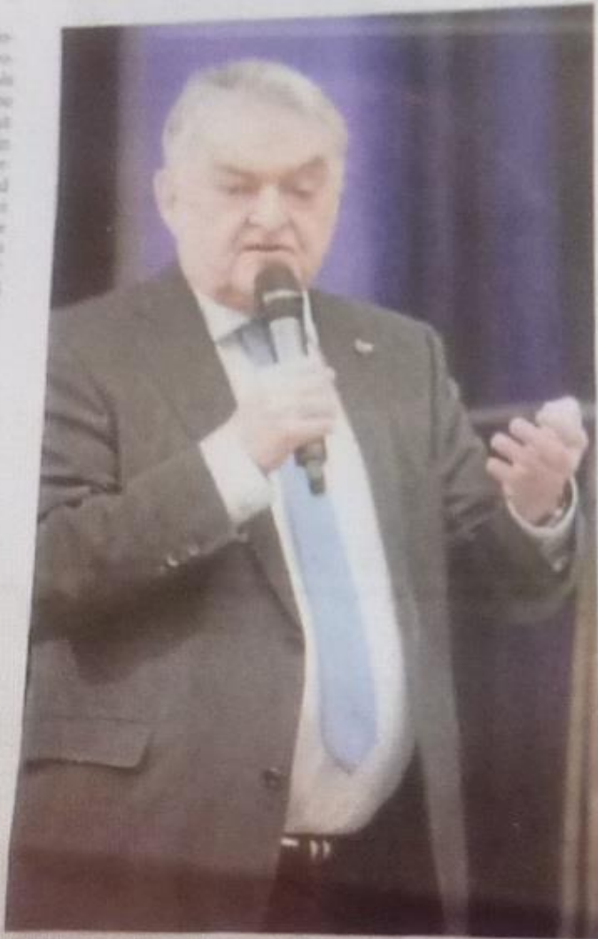
NRW-Innenminister Herbert Reul (CDU) erntet viel Zuspruch für seine Warnung vor extremistischen Tendenzen.

Die Demokratie bedeutet nicht nur, dass jede Stimme zu respektieren ist. Die Verantwortung gegenüber den Bürgerwillen ist ein zentraler Bestandteil der Demokratie. Die Demokratie ist ein Prozess, der sich ständig weiterentwickelt. Die Demokratie ist ein Prozess, der sich ständig weiterentwickelt. Die Demokratie ist ein Prozess, der sich ständig weiterentwickelt.