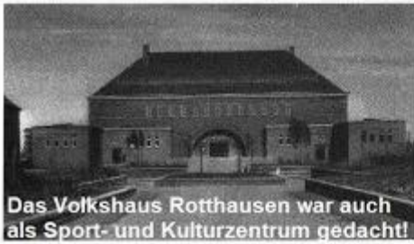
Das Volkshaus Rotthausen war auch als Sport- und Kulturzentrum gedacht!

Bundespräsident Herr Frank-Walter Steinmeier meint, dass wir unsere Erwartungen und Wünsche kundtun sollen... Wichtig - Drogenkonsum eindämmen