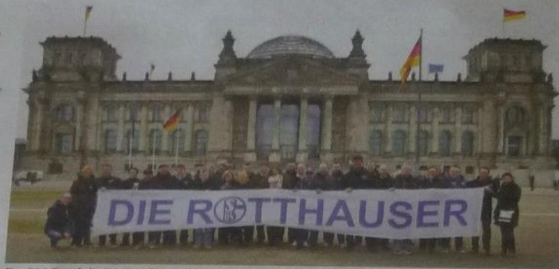
Der S04-Fanclub „Die Rotthäuser“ hofft in der kommenden Saison wieder auf Auswärtsfahrten. Nach Berlin wird es nicht gehen, denn Schalke 04 spielt dann nur noch in Liga zwei.

„Das Fanclub-Leben liegt völlig brach, alle Aktivitäten sind eingestellt. Zuletzt haben wir uns im Oktober 2020 gesehen. Danach ging überhaupt nichts mehr. Gelegentlich haben wir uns online mit einigen Mitgliedern getroffen, der Vorstand und die Kassierer fanden sich zudem einmal