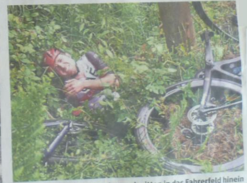
Szenen des Grauens statt des sportlichen Wettkampfes: Eine Frau läuft mit einem Pappschild und in die Kamera schauend mitten in das Fahrerfeld hinein (Bild oben). Das Ergebnis ist ein schwerer Massensturz (unten links). Auch den Schweizer Marc Hirschi (rechts) erwischte es.

„Da haben sich Omi und Opi aber gefreut!“