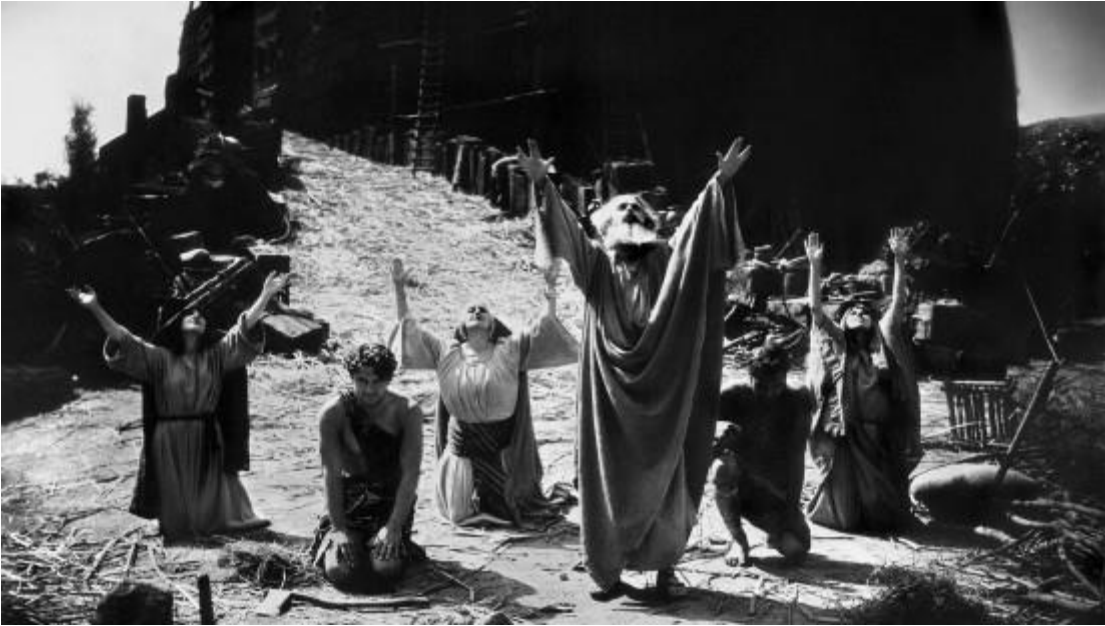
Auch der christliche Gott ist ein

strafender „Wettergott“ – zumindest im Alten Testament