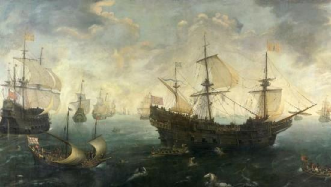
Der Invasionsversuch der

spanischen Armada 1588 endete als Fiasko – und daran war das Wetter maßgeblich mitbeteiligt