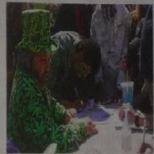
Kiffer konnten sich in New York einen Joint to go abholen.

In Washington D.C. hätten ähnlich gestimmte Aktivitäten fast 1000 Joints gebaut. Bereits am frü-