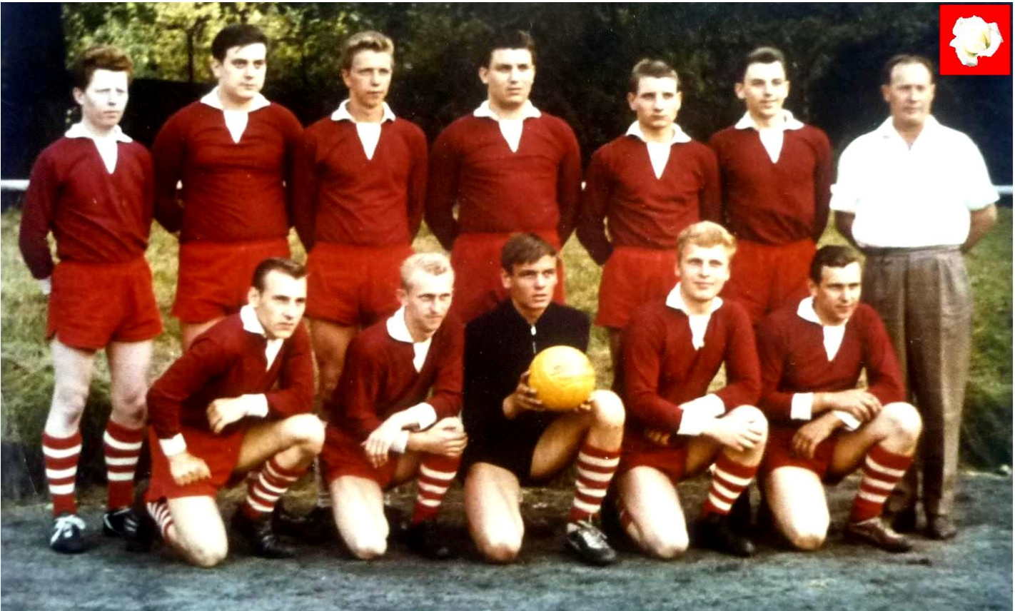
Elf Mann - Elf Freunde bildeten eine Mannschaft. Wenn sich jemand verletzte, wurde mit 10 Leuten gespielt, bis zum Abpfiff nach 90 Minuten. Das prägte die ehrliche Sportkameradschaft. Der auf diese Art erfahrene Teamgeist schweißte die Menschen in den Vereinen zusammen.