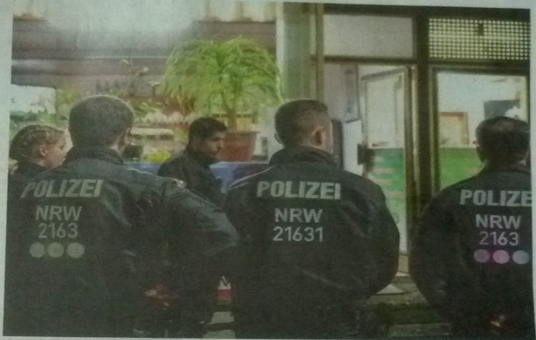
Ein Großeinsatz in Gelsenkirchen: Durchsucht wurden unter anderem Cafés und Shisha-Bars.

Ohne Lagebild allerdings bleiben der Polizei für ihre Ermittlungen bedeutsame Zusammenhänge verborgen. Denn es kommt offenbar eine bedrohliche Entwicklung auf Gelsenkirchen und seine Re-