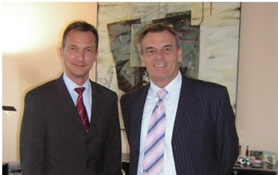
Die Sportpolitik würgte das EU-Projekt ab, dass es ab 2004 nicht zur Entfaltung kam. Ein fehlerhafter Missbrauch des Sports durch Politiker aller Couleur.

Es wird alle Zeit das Image der SPD sein - Vom Schirmherrn der Veranstaltung, zum Dieb, Rufmörder und Projektzerstörer. Die unrühmliche Sportkarriere des Gelsenkirchener OB und seiner Helfershelfer aus der Sportpolitik aller Parteien. Es stellt sich die Frage: „Darf die Politik Sportlehrer schädigen?“