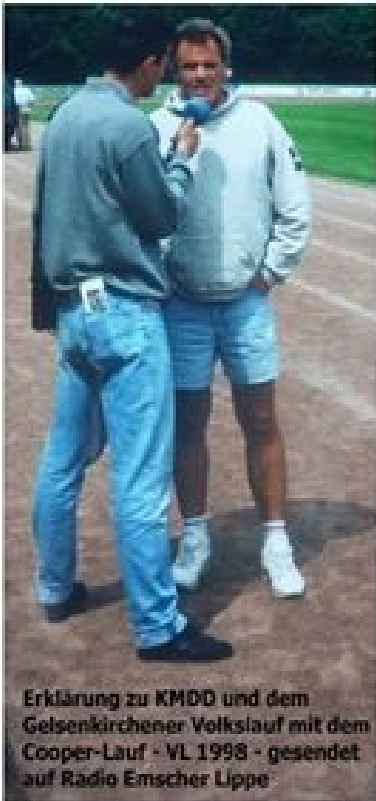
Erklärung zu KMDD und dem Gelsenkirchener Volkslauf mit dem Cooper-Lauf - VL 1998 - gesendet auf Radio Emscher Lippe