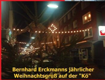
Bernhard Erckmanns jährlicher Weihnachtsgruß auf der "Kö"

Frohe Weihnachten Ein gesundes Neues Sportjahr 2017 wünschen