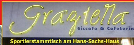
Sportlerstammtisch am Hans-Sachs-Haus

Winterlicht in Gelsenkirchen Der GMC wünscht allen Sportlern Frohe Weihnachten und einen guten Rutsch ins Neue Jahr. Man sieht sich beim Neujahrslauf