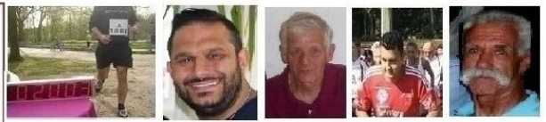
... für Sportler

"Sport verbindet alle Menschen weltweit. Bis Glaube und Politik, sie durch das Schüren von Begehrlichkeiten aller Art wieder auseinander dividieren. Darum setze mit uns, durch Deine Teilnahme am 23. April 2017 beim HOMAMA, ein aktives Zeichen, gegen Doping und Drogen im Sport, sowie gegen Ausländerfeindlichkeit und Antisemitismus!"