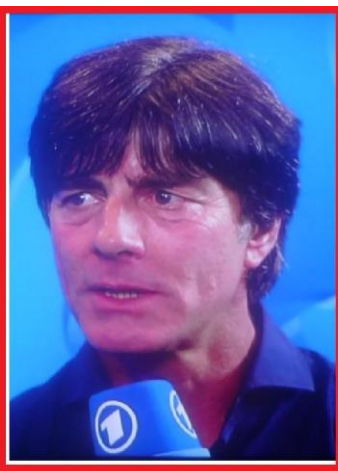
Fußball-Weltmeister nach 1:0 Sieg gegen Argentinien - Trainer Joachim Löw