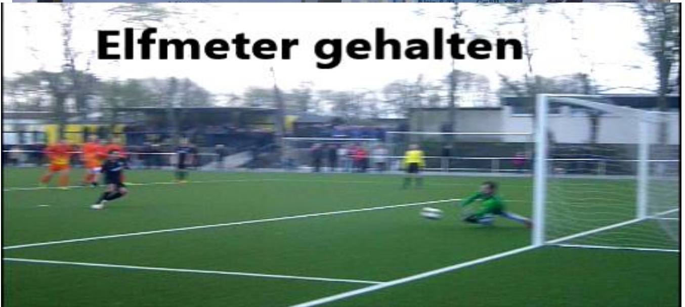
Torwart Koppers hält den Elfmeter und damit auch die Punkt im Sportpark „Auf der Reihe“ beim Spiel gegen den FC Vorwärts BO-Kornharpen fest