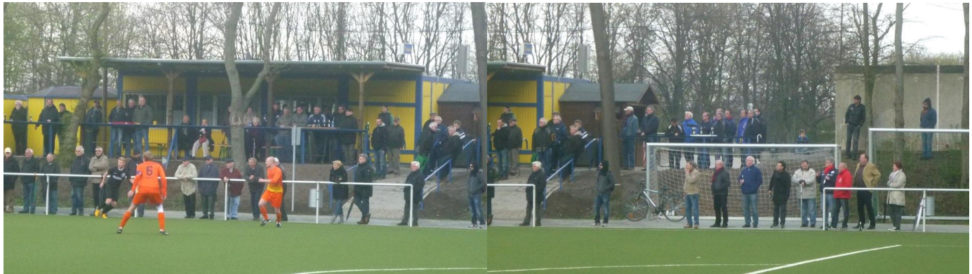
Die Kulisse hielt sich, wie immer gegen Bochumer Vereine wieder in überschaubaren Grenzen. Die Sonntagsspiele der Bundesliga nagen weiterhin am Aufkommen der Zuschauer bei den Amateuren.