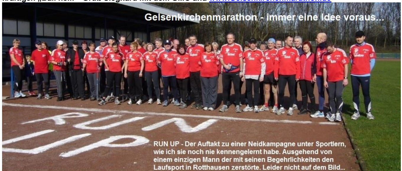
Foto aus einer Zeit, als ich noch glaubte, gute Arbeit im Sport geleistet zu haben - Ich habe die Falschheit der „Muttersöhnchen“ unterschätzt. Mit Fußballern des alten Schlages wäre mir so etwas nicht passiert. Deswegen auch Frauenlauf - weil ich glaube, dass Frauen mehr Gefühl für echte Lebensqualität und den

Wünsche allen sportlichen Erfolg am Wochenende mit einem „Ball heil!“ Sagt man das eigentlich immer noch bei der Begrüßung am Mittelkreis: "Wir begrüßen den Gegner und den Schiedsrichter mit einem kräftigen „Ball heil!“ Gruß Sieghard mit dem GMC und www.Gelsenkirchenmarathon.de