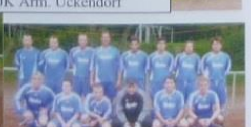
BW GE 2. Herrenteam