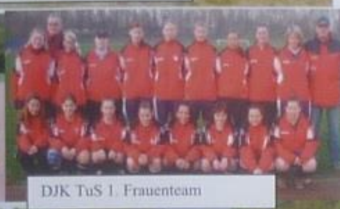
DJK TuS 1. Frauenteam