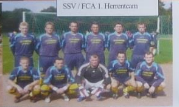
SSV / FCA 1. Herrenteam