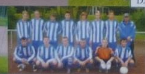
BW Gelsenkirchen A-Jugend