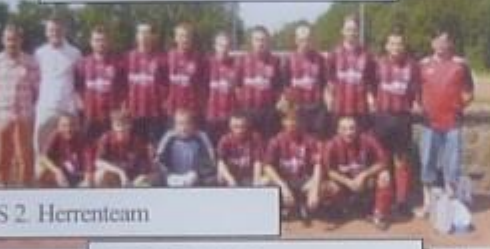
DJK TuS 2. Herrenteam