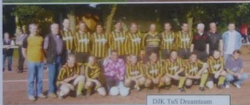
DJK TuS Dreamteam