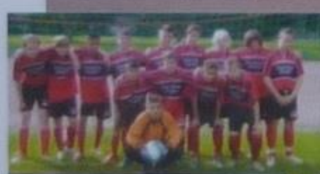
DJK TuS C-Jugend