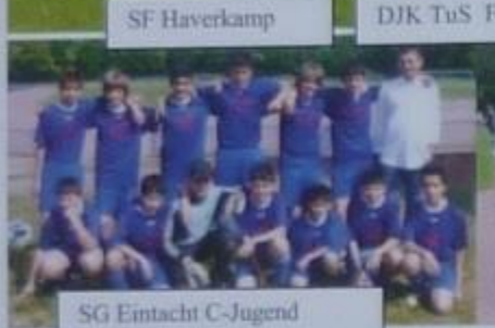
SG Eintacht C-Jugend