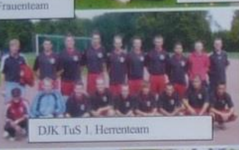
DJK TuS 1. Herrenteam