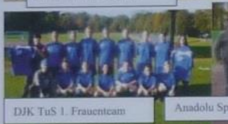
DJK TuS 1. Frauenteam