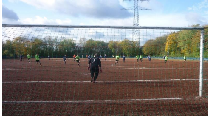
Spielbeginn am Tossehof SF Bulmke gegen DJK Adler Feldmark