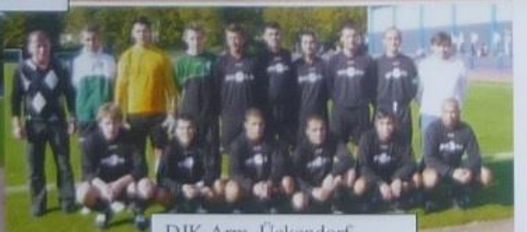
DJK Arm. Ückendorf