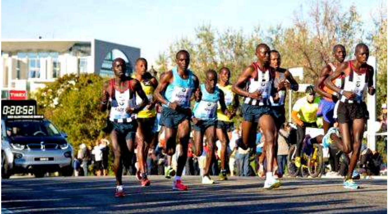
Berlin-Marathon-Bericht von RBB-Online

Homepages: www.fussballkondition.de www.gelsenkirchenmarathon.de Webmaster, Sieghard Tinibel