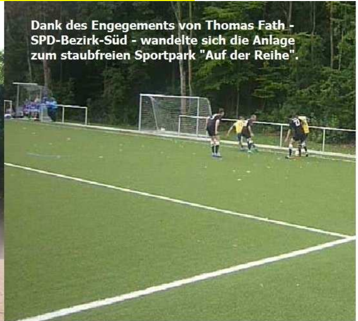
Dank des Engagements von Thomas Fath - SPD-Bezirk-Süd - wandelte sich die Anlage zum staubfreien Sportpark "Auf der Reihe".