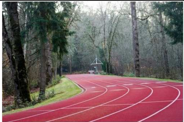
So könnte die DFB-Cooper-Strecke im Gesundheitspark-Nienhausen ausgesehen haben, wenn Rolf Rüssmann 2005 nicht so schwer erkrankt wäre!

Folgende Veranstaltungen des GMC im Jahre 2014 zielen gegen Doping und Drogen im Sport. Die bekannten und neuen Termine sind am 1. Januar 2014 in der Feldmark - am 5. April 2014 in der Feldmark - am 1. Mai 2014 in Bulmke am Tossehof - am 7. September 2014 wiederum in der Feldmark.