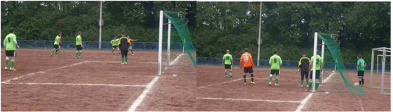
Bulmke I gegen VfB 09/13 II mit 4:3 Sieg

Sportfreunde Bulmke 67 e. V. - I. Mannschaft 2013/2014