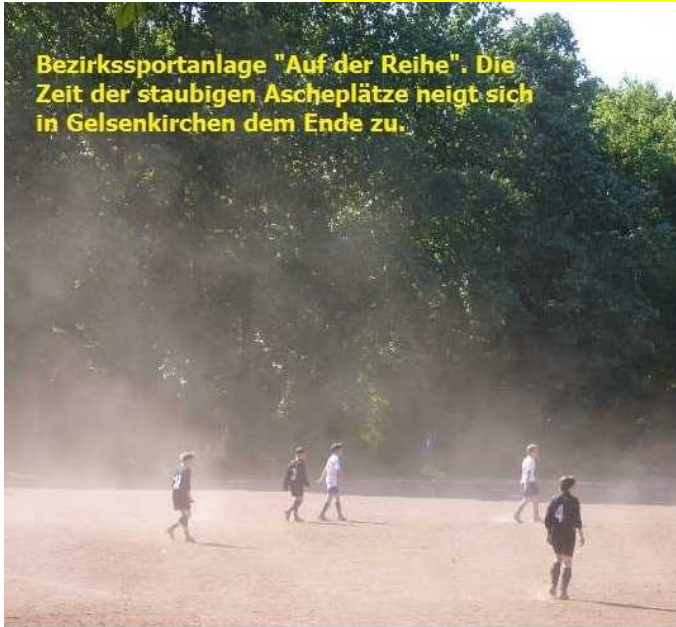
Bezirkssportanlage "Auf der Reihe". Die Zeit der staubigen Ascheplätze neigt sich in Gelsenkirchen dem Ende zu.