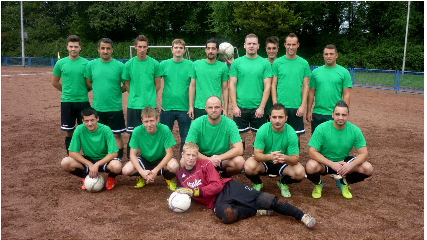
Das Team des VfB 09/13 war der erwartete schwere Gegner und die Erstvertretung tat sich recht schwer gegen eine Zweite des Vereins aus der Feldmark