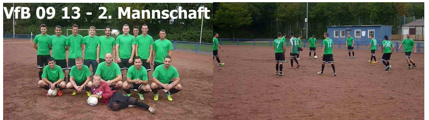
VfB 09 13 - 2. Mannschaft