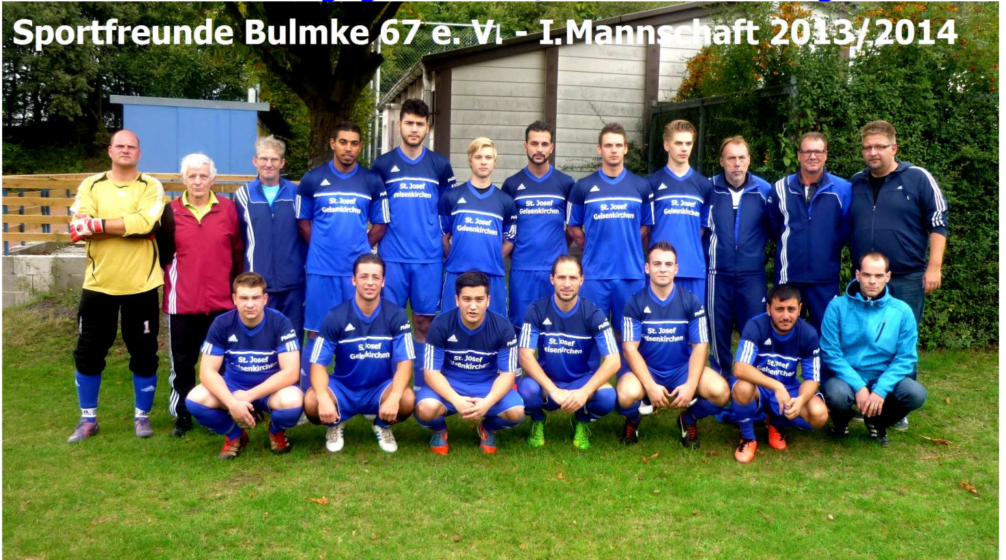
Das Team mit Trainer und Vorstand vor dem Spiel auf der Sportanlage an der Plutostraße in Gelsenkirchen-Bulmke

Sportfreunde Bulmke 67 e. V. - I. Mannschaft 2013/2014