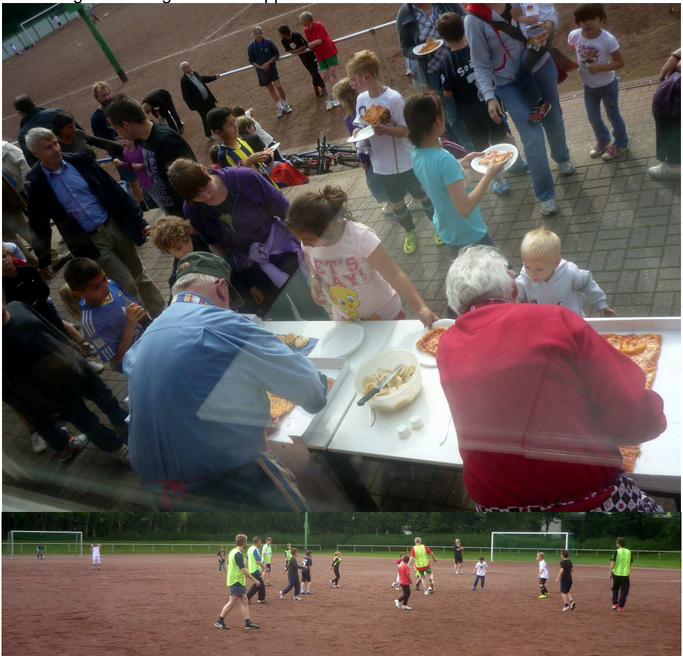
Spiel an der frischen Luft macht Spaß und gibt Appetit ...

In einer zweiten Phase werden die Jugendlichen nun durch eine Art Patenschaft mehrerer Rotarier bei Bewältigung anstehender Probleme begleitet und durch begleitende regelmäßige Veranstaltungen für die gesamte Gruppe unterstützt.