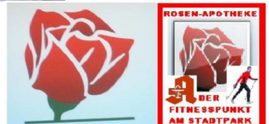
Die Rosen-Apotheke - Ihr Fitnesstreffpunkt im Kirchviertel der Stadt Gelsenkirchen