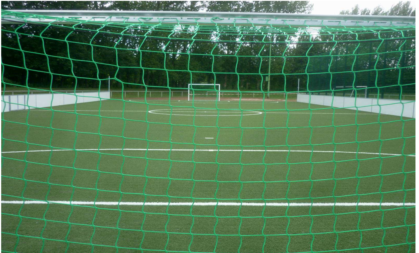
Neue Perspektiven im Feldmarkstadion durch das neue Spielfeld für die Sportabteilung erblindeter Fußballspieler des VfB Gelsenkirchen 09/13.