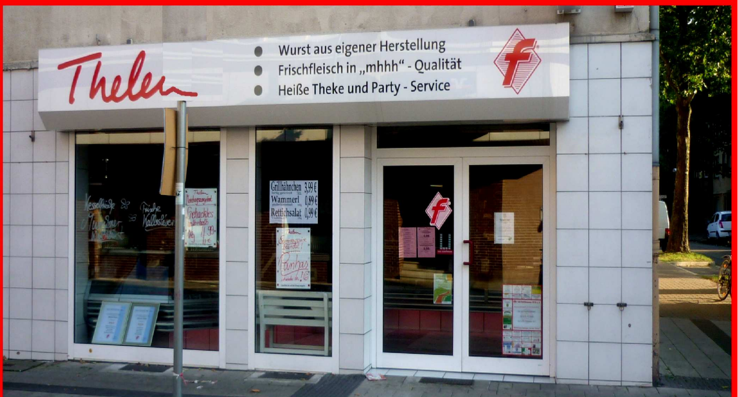
Der "mhhh" Metzger an der Karl-Meyer-Straße...