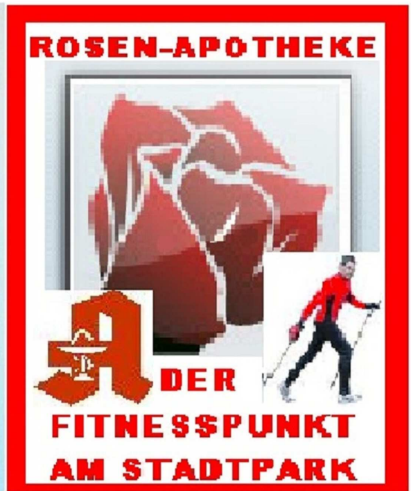
Die Rosen-Apotheke - Ihr Fitnesstreffpunkt im Kirchviertel der Stadt Gelsenkirchen