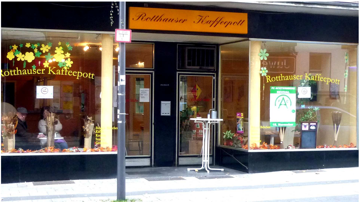
Im „Rotthausener Kaffeepott“ treffen sich eingangs der Karl-Meyer-Straße auch die Liebhaber des belebenden Getränks. Sommertags wird die Karl-Meyer-Straße zum Straßencafe.