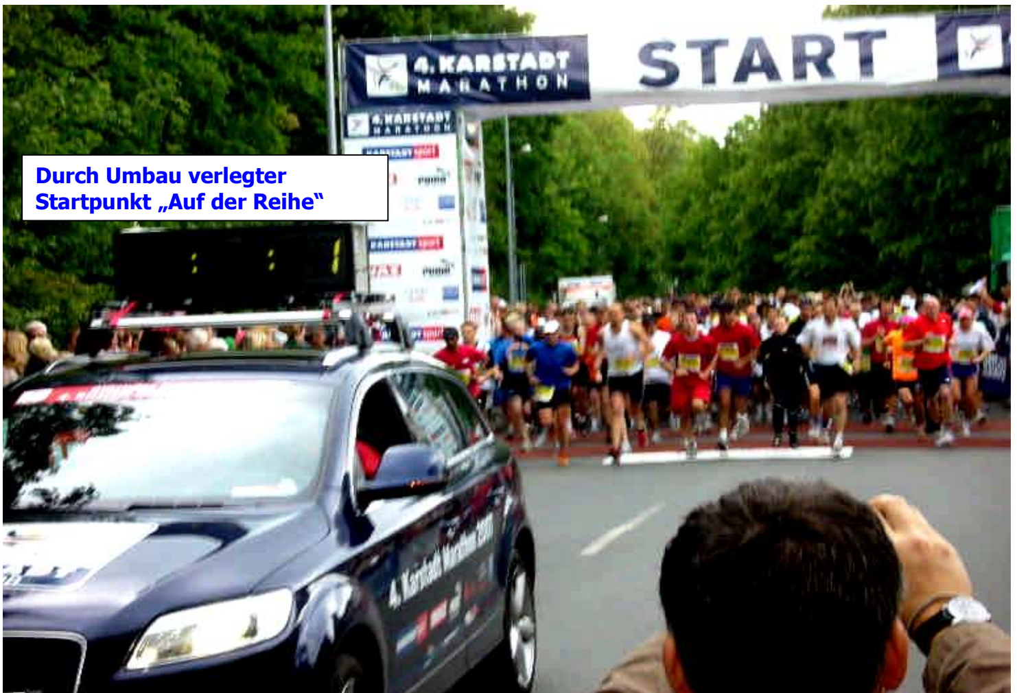
Durch Umbau verlegter Startpunkt „Auf der Reihe“