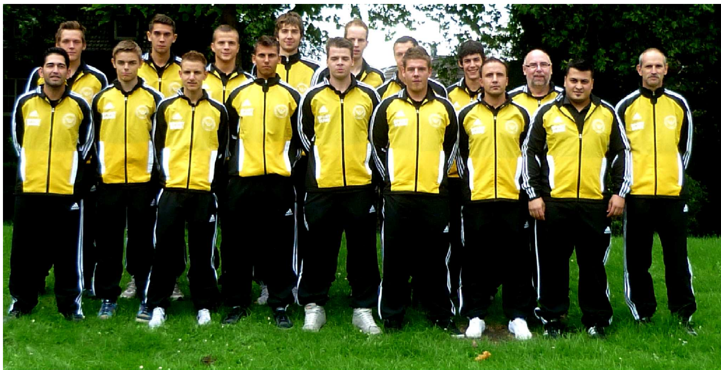
DJK Adler Feldmark 1922 e. V. - 1. Mannschaft

Zwoten stellen sich nach Ablauf der Sperren einige Leute mehr zur Verfügung, die das 2:4 von diesem Wochenende vergessen machen könnten. Die Erstvertretung sinnt auch auf Wiedergutmachung nachdem man das Spiel gegen DJK Arminia Ückendorf 1:4 auf eigenem Platz verloren hatte.