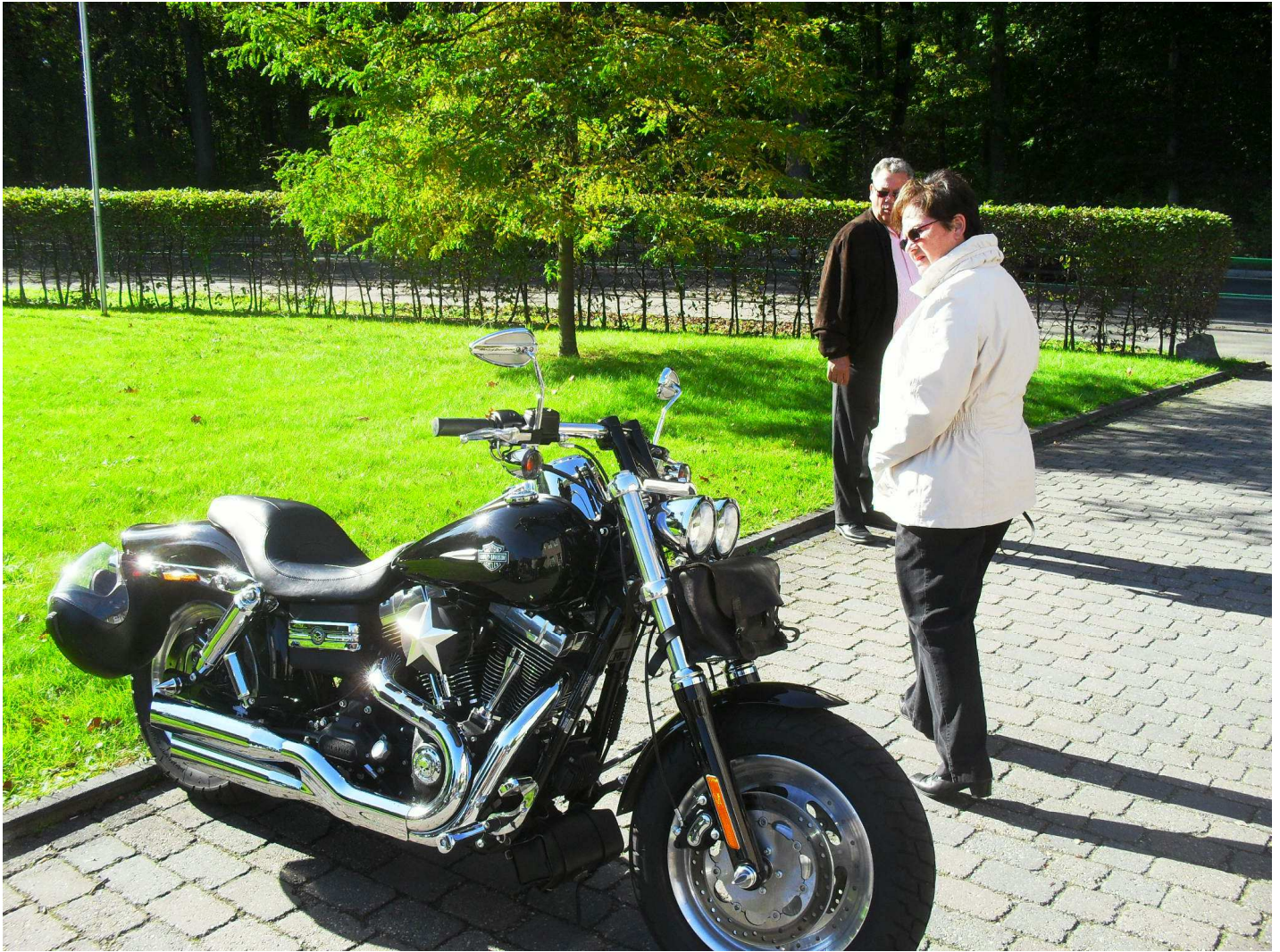
Eine der zahlreich geparkten Harleys am „Lake Side Inn“. Haltern scheint ein Knotentreffpunkt zu sein für „Mopedfahrer“ aller Klassen an verschiedenen Stellen des Sees und auf dem Wege dorthin.