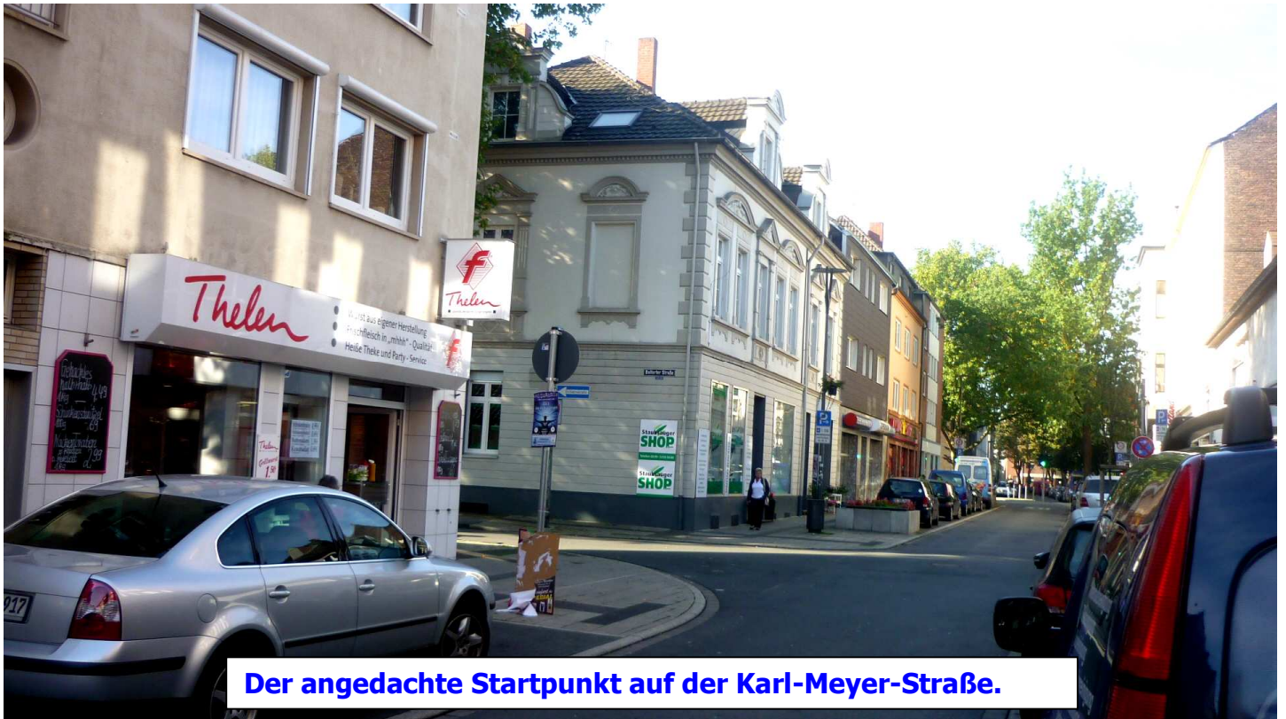
Der angedachte Startpunkt auf der Karl-Meyer-Straße.