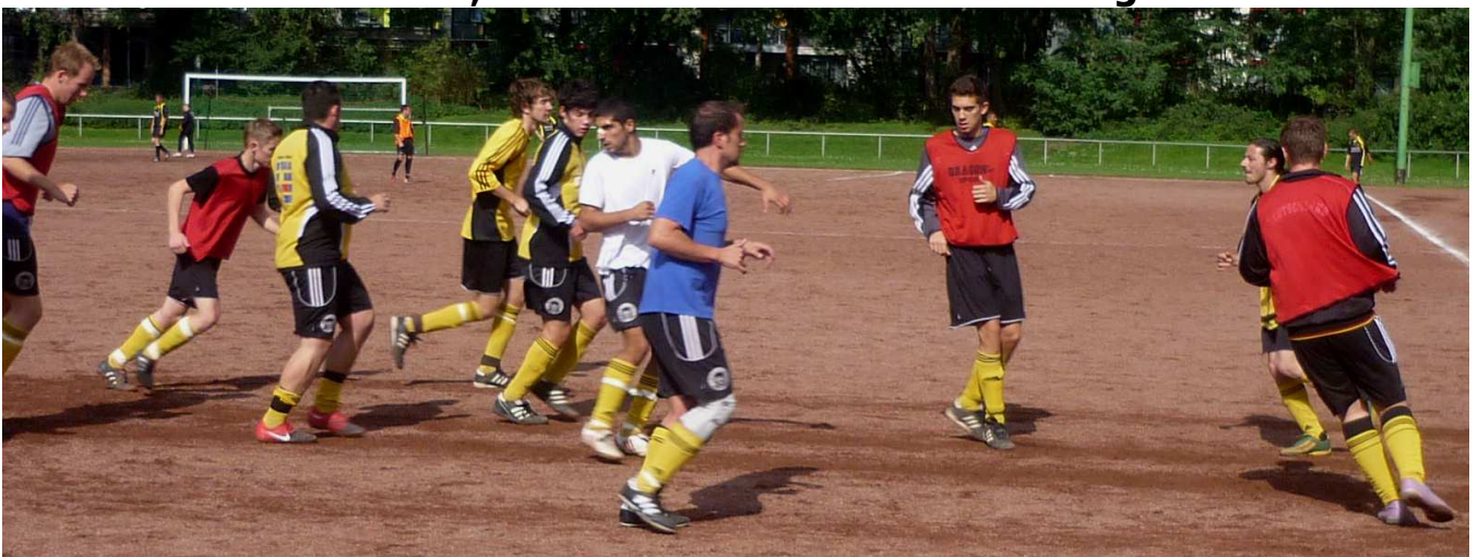
...dann wird sich gewissenhaft für das Spiel aufgewärmt