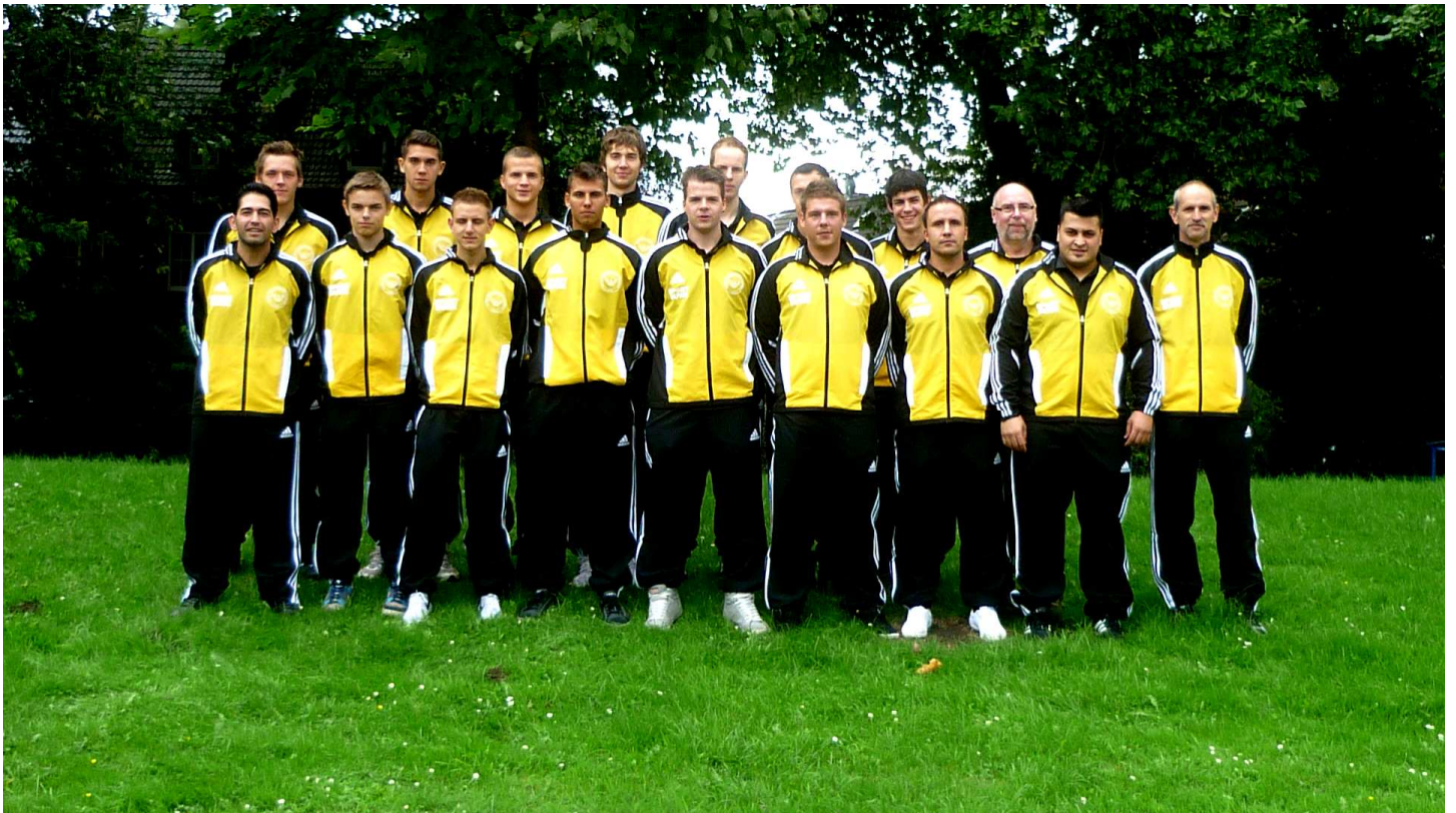
DJK Adler Feldmark Erste Mannschaft

Kommenden Sonntag spielt die Adler Erste bei den Sportfreunden Bulmke am Tosehof in der Plutostraße. Anstoß 15:00 Uhr. Die Spieler der Zwoeten treffen sich um 12:00 Uhr an der Fürstinnenstraße zum M-Spiel beim FC Gladbeck. Anstoß: 13:15 Uhr.