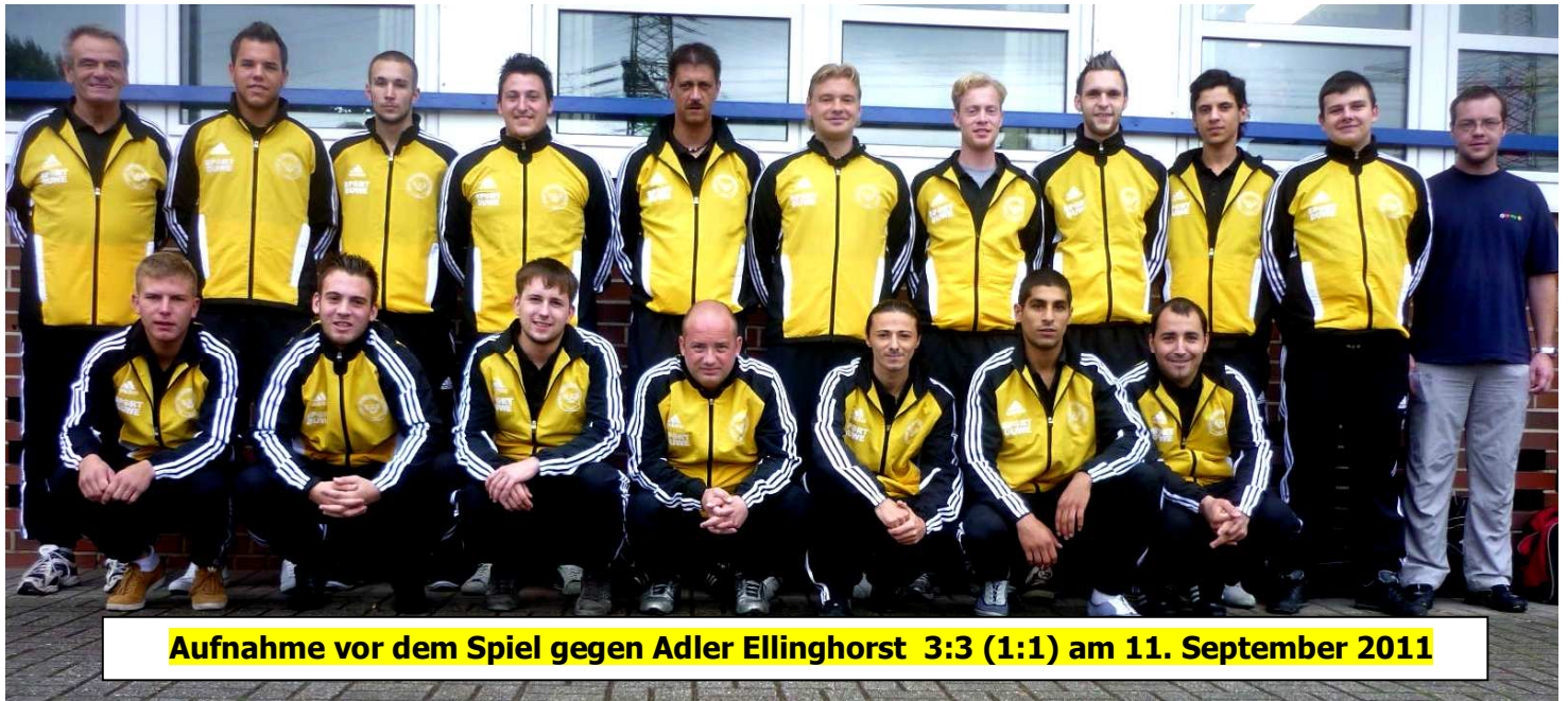
Aufnahme vor dem Spiel gegen Adler Ellinghorst 3:3 (1:1) am 11. September 2011