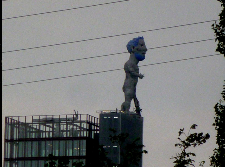
Mit solch einem mächtigen „Schutzpatron“ wie dem Herkules kann man ja nur gewinnen.