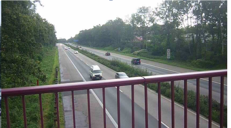
Über die Autobahnbrücke geht's dann zum Gesundheitspark Nienhausen im Stadtsüden.