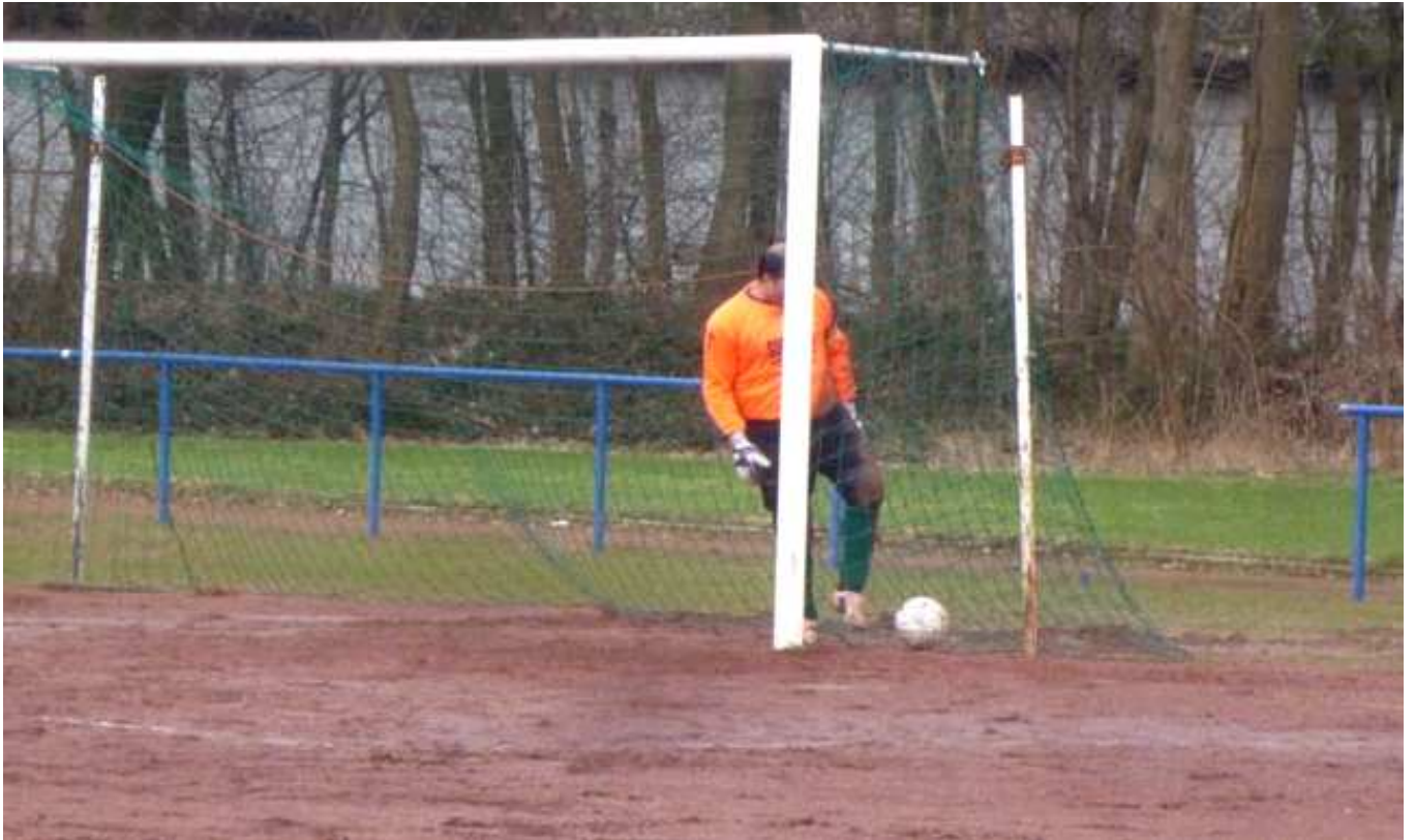
Fünfmal muss der Gästekeeper den Ball aus seinem Netz holen..