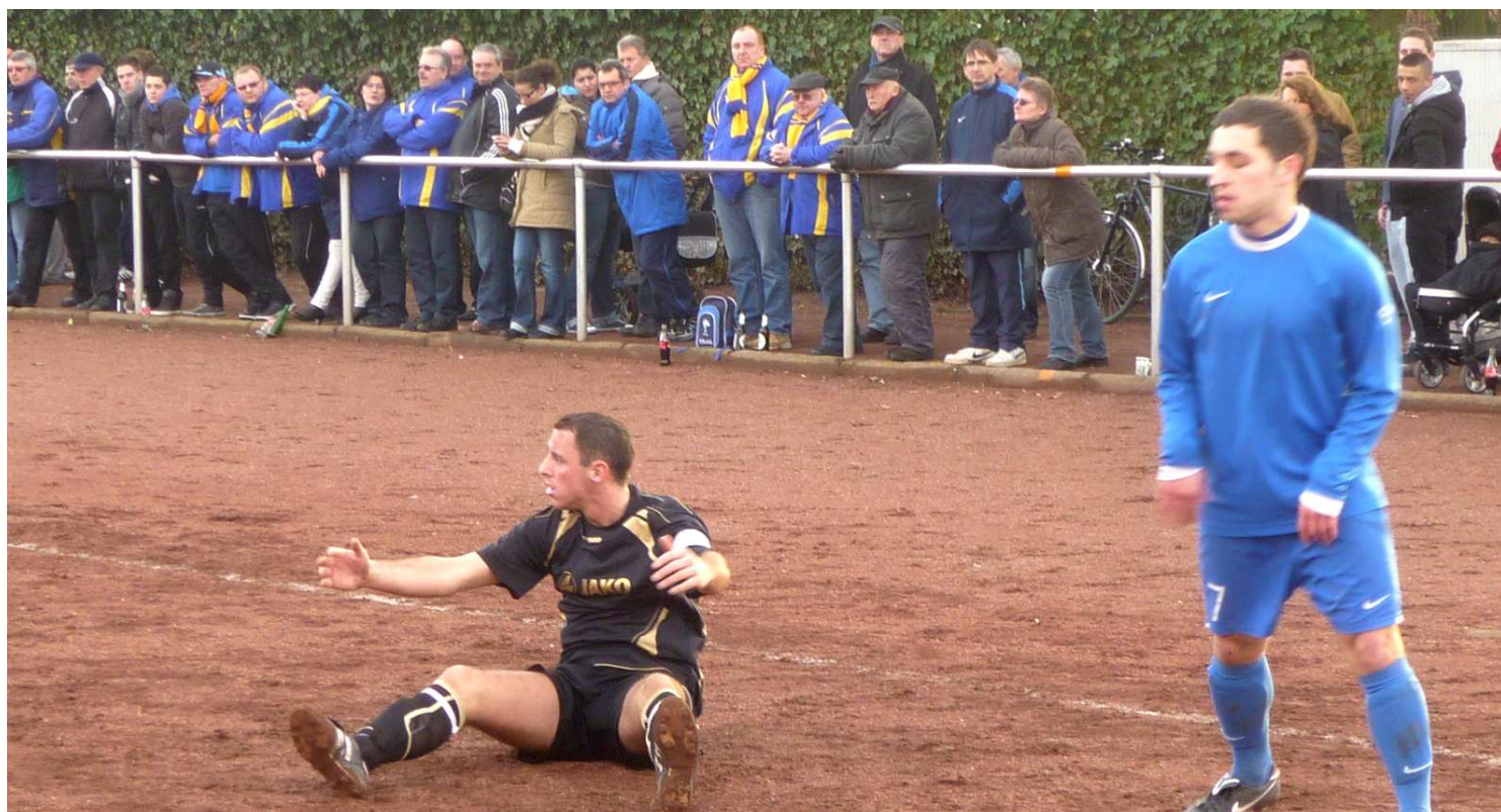
Ein echtes Spitzenspiel der Kreisliga A mit Haken und Ösen und vielen Fans in den Vereinsfarben des Gastes aus Rotthausen. Kurz darauf fällt das 3:0 für SV Hessler und die Zweite Mannschaft hatte ihren Spaß am temporeichen Spiel.