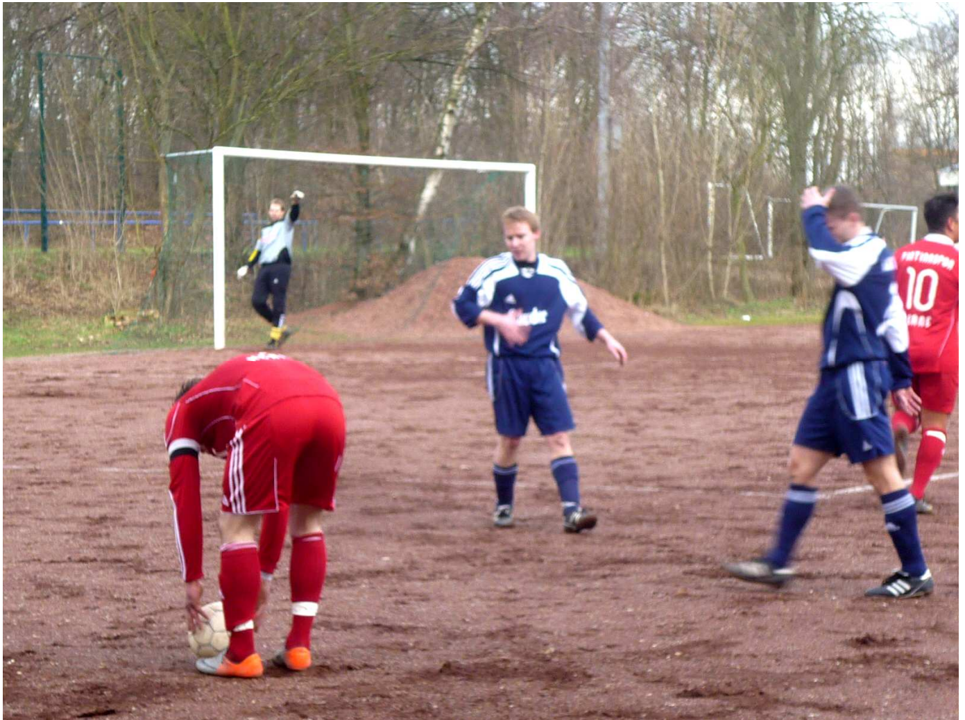
Freistoß für Firtinaspor Wanne in Höhe des 16m-Raumes ---