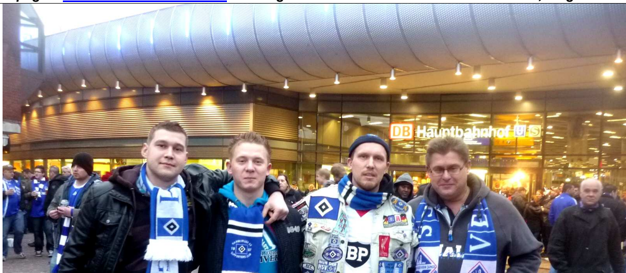
Vor dem Spiel S04 gegen den HSV am Hauptbahnhof..

Fußballextra seit 1984 - Saison 2010/2011 - Laufende Nr. 0026 vom 18. Jan. 2011 ++ Sportliche Mitteilungen nicht nur für Rotthausen und den Gelsenkirchener Süden ++ Homepages: www.fussballkondition.de www.gelsenkirchenmarathon.de Webmaster, Sieghard Tinibel