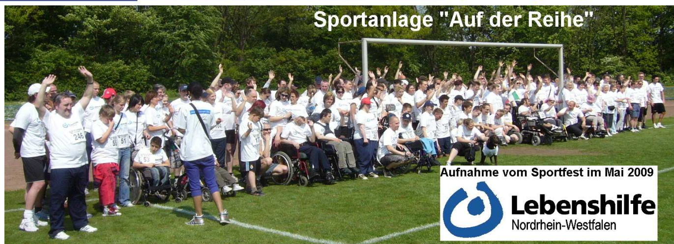
Sportanlage "Auf der Reihe"

Der Mottolauf findet jährlich zu Gunsten der Lebenshilfe e. V. statt. Eine freiwillige Spende wird gerne vor und nach dem Start auf der Sportanlage angenommen.