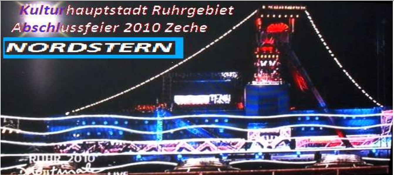
Das Jubiläumsjahr der DJK TuS 1910 endete wie es begann: Mit Eis und Schnee zu den Feiern zur Kulturhauptstadt 2010 und dem Jahrtausendwinter zu den Weihnachtsfeiern.

Homepages: www.fussballkondition.de www.gelsenkirchenmarathon.de Webmaster, Sieghard Tinibel