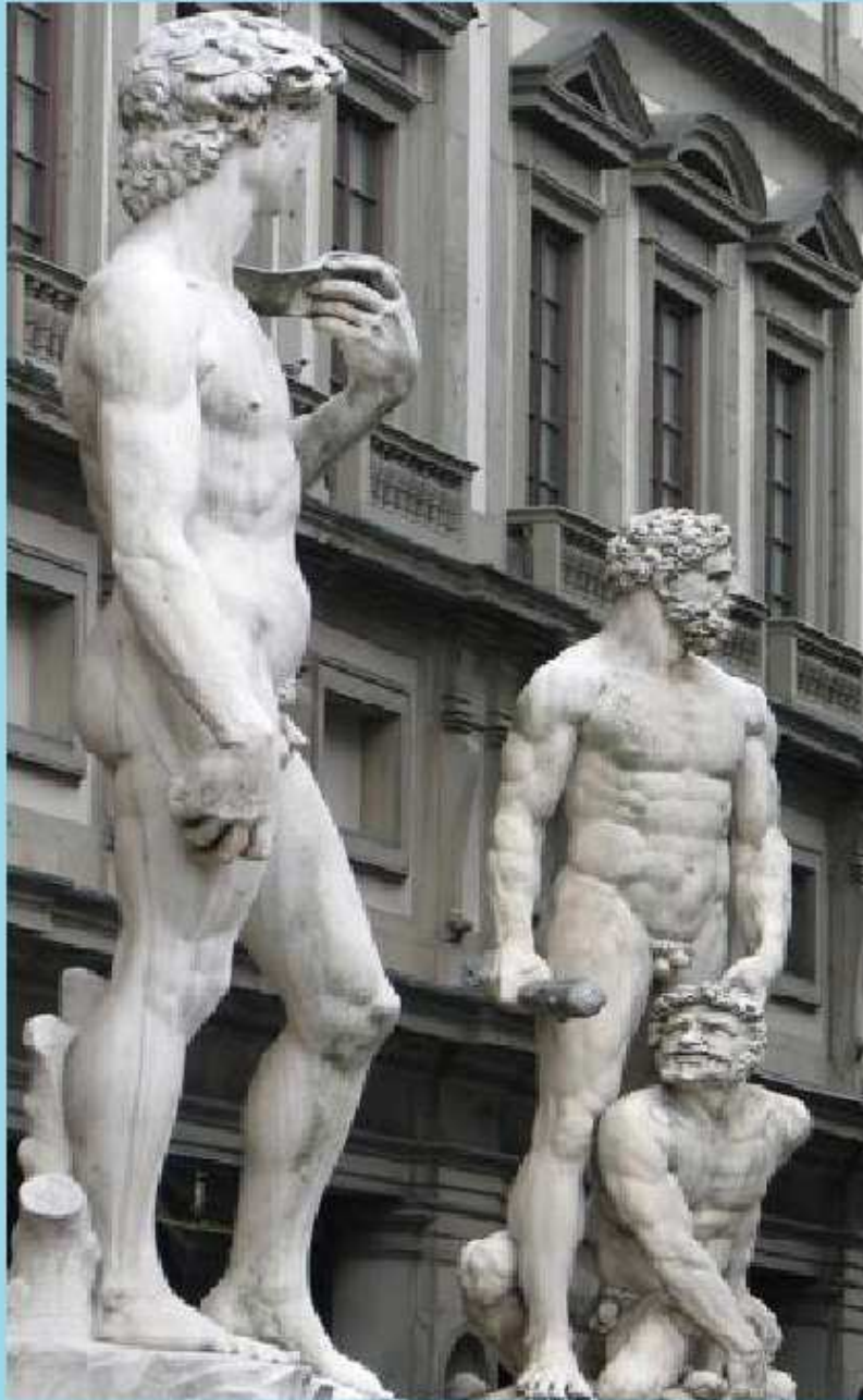
Piazza della Signoria in Florenz - David (links) Herkules (rechts) erschlägt den Feuergott Cacus mit seiner Keule. Bildende Kunst von Michelangelo und Bandinelli im 16. Jahrhundert n. Ch.

Vor dem Eingang zum Palazzo Vecchio steht auf der linken Seite eine Kopie der David-Statue von Michelangelo, deren Original in der Galleria dell' Accademia steht.