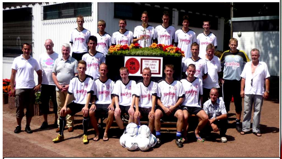
1. Mannschaft im Jubiläumsjahr