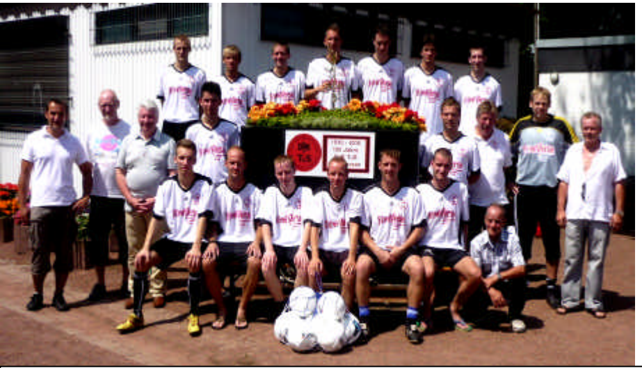
1. Mannschaft im Jubiläumsjahr Bezirkssportanlage „Auf der Reine“