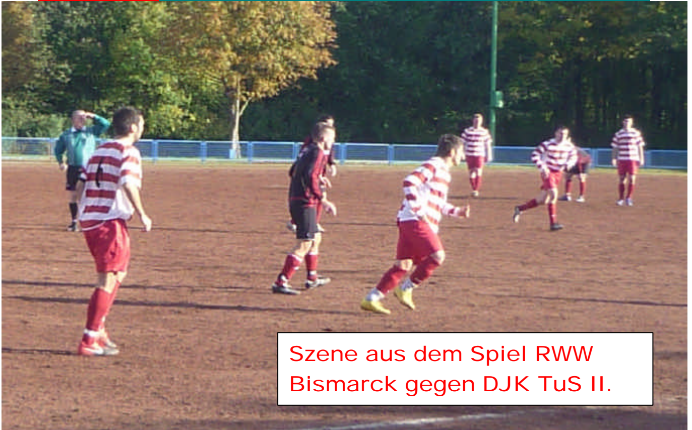
Szene aus dem Spiel RWW Bismarck gegen DJK TuS II.

Zweite Mannschaft spielt torlos Unentschieden gegen RWW Bismarck. Die DJK TuS Dritte hatte Sonntag spielfrei.