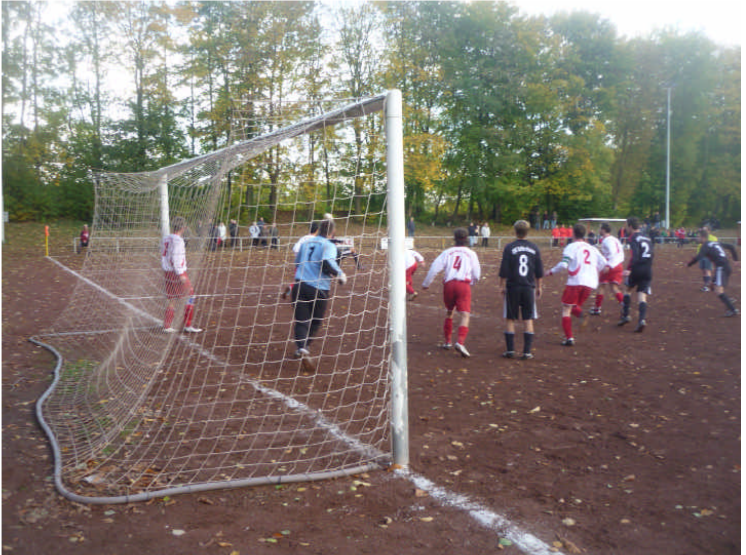
Angriff DJK TuS Rotthausen

Hoffenheim einige Zuschauer zum Sport der kleinen Vereine in Wattenscheid Leithe. Im großen Lohrheidestadion der SG Wattenscheid verliefen sich gerade einmal 269 zahlende Zuschauer beim Spiel der 4. Liga Bochum gegen Koblenz.