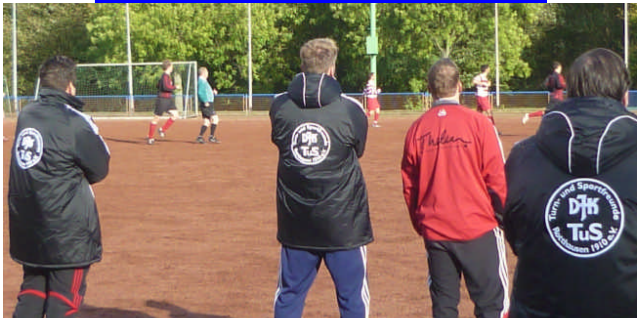
Beim Spiel der Zweiten gegen RWW Bismarck sahen die Trainer am Spielfeldrand keine Tore.