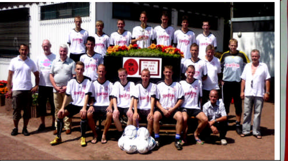
1. Mannschaft im Jubiläumsjahr