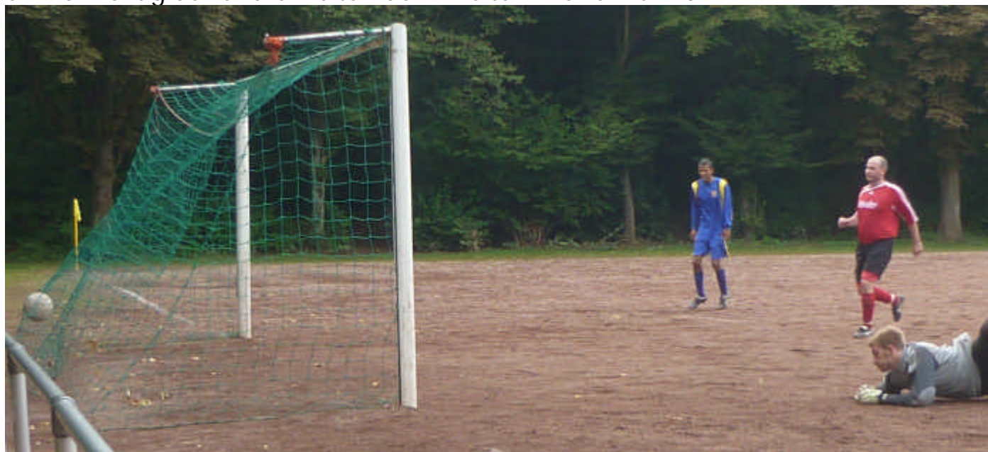
Hier fällt das 0:2 für Union Gelsenkirchen