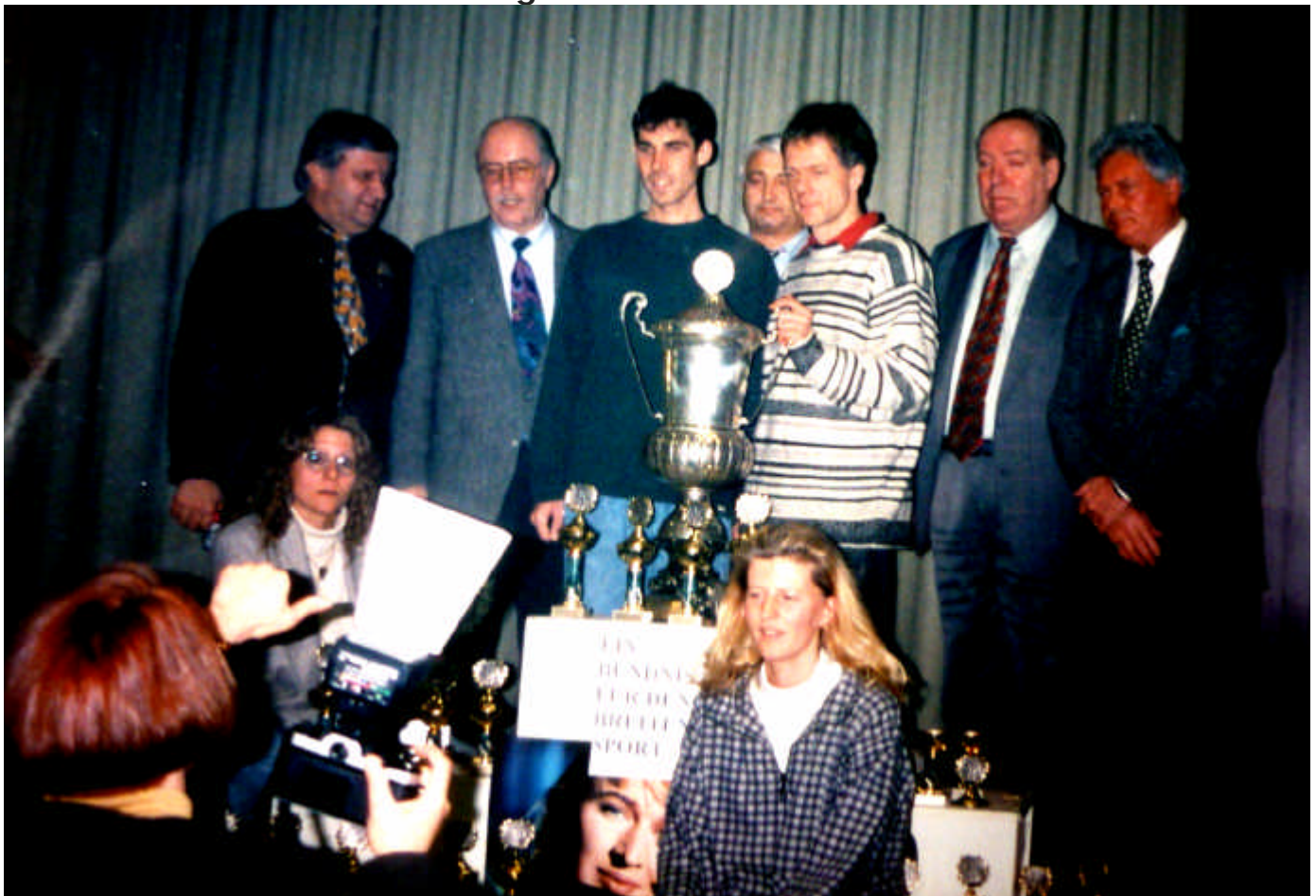
Jahreshauptversammlung der DJK Sportfreunde 1910 – Für den kommenden