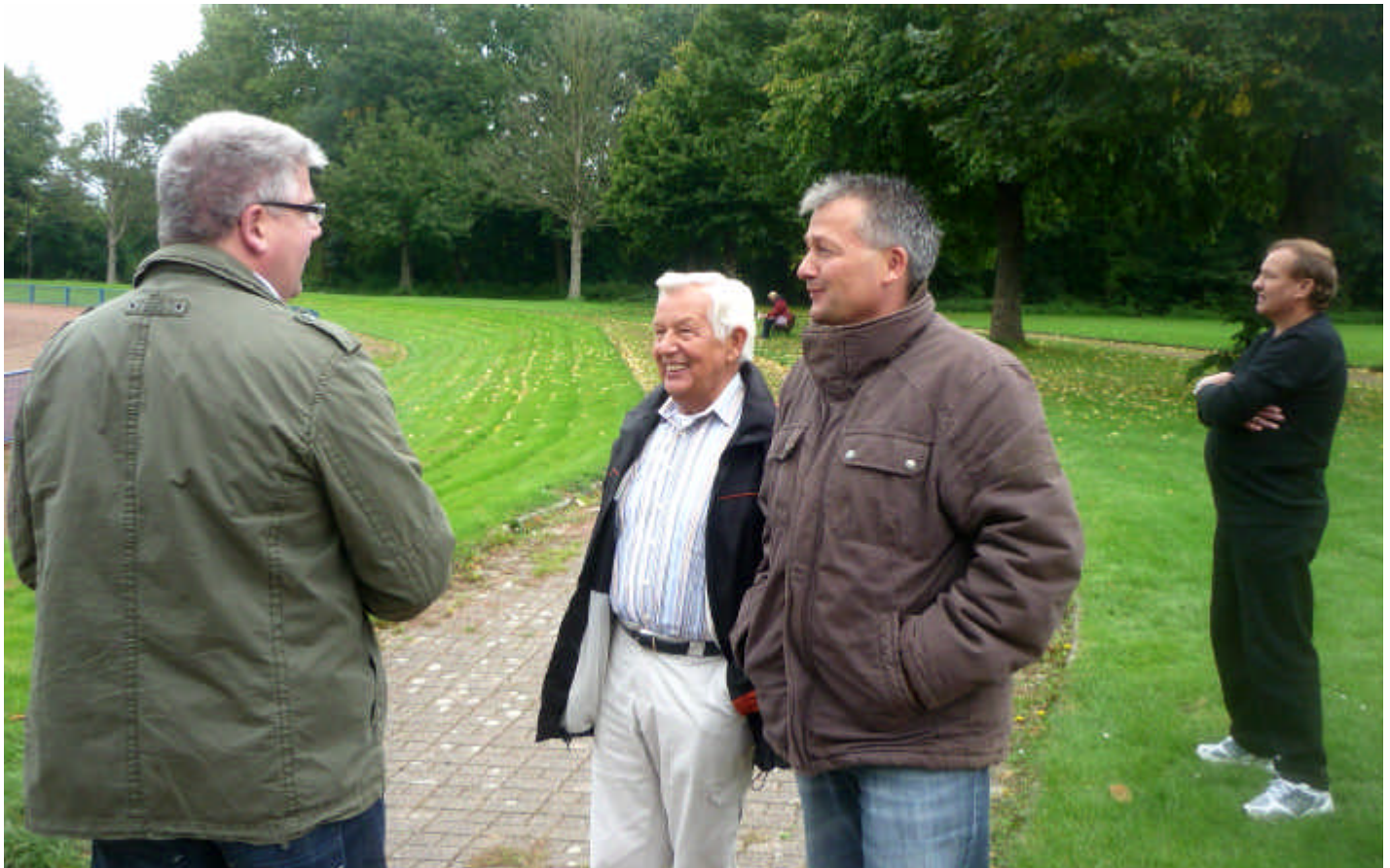
Kommen immer gerne nach Rotthausen – Riemker Schlachtenbummler am Rande und auf der Tribüne des gepflegten Rasenplatzes „Auf der Reihe“.