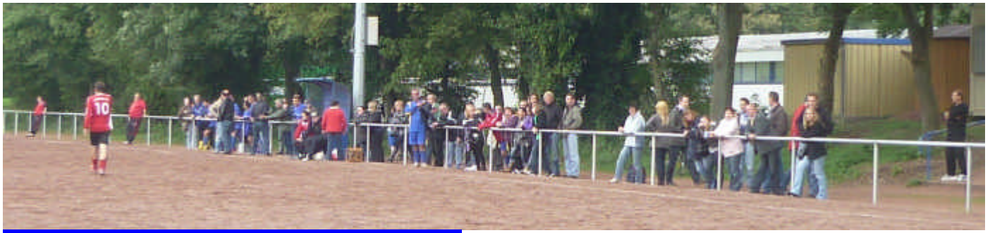
Zuschauer bei der Dritten Mannschaft.