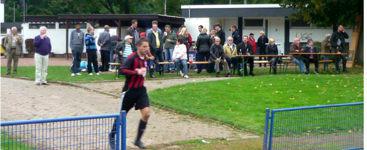
Christian musste sich auch beeilen zum Anpfiff der Begegnung pünktlich zu sein.