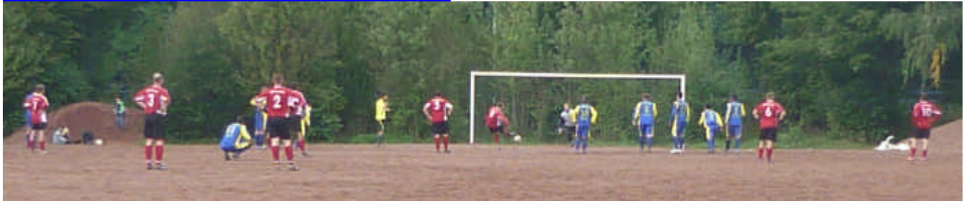
DJK TuS Vergibt einen Elfmeter. Der Union Keeper kann den Ball abwehren..

Bereits am kommenden Samstag gibt es nun aber die Gelegenheit, die nächsten Punkte einzufahren. Dann tritt unsere dritte Mannschaft um 13.15 Uhr am Schulzentrum Ückendorf gegen die Zweitvertretung von FC Zrinski an.