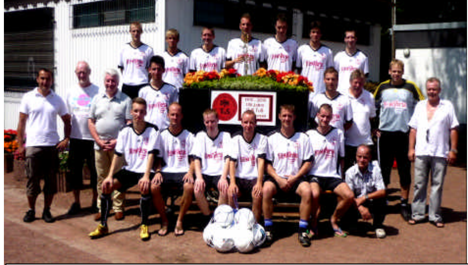
1. Mannschaft im Jubiläumsjahr