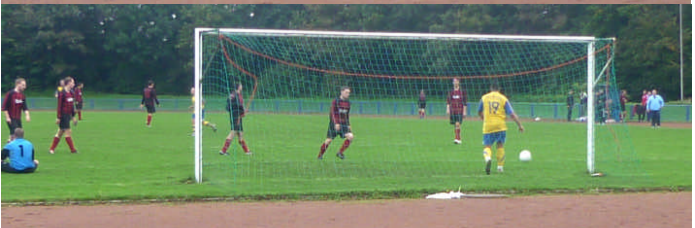
...beim Tor zum 4:3 Endstand sah er etwas unglücklich aus.