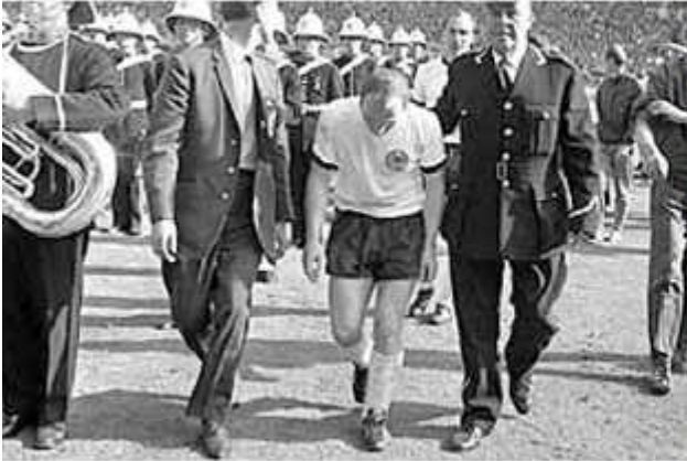
UWE SEELER WEMBLEY 1966

MAN SIEHT SICH IMMER ZWEI MAL IM LEBEN! YOU ALWAYS MEET TWICE IN LIFE!