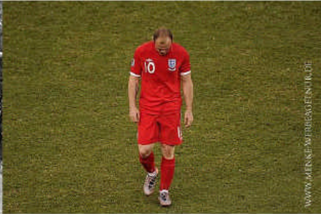
WAYNE ROONEY BLOEMFONTEIN 2010