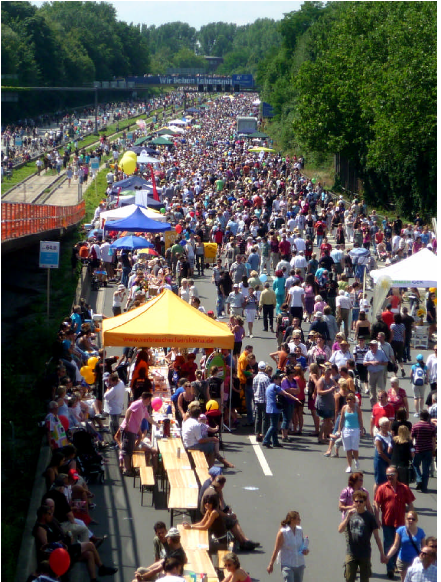
A 40 Auffahrt Essen-Kray – wie fast immer auf der alten B1 – Stau. Ein ähnlicher Menschauflauf bei der Love-Parade in Duisburg verursachte ein tragisches Unglück.