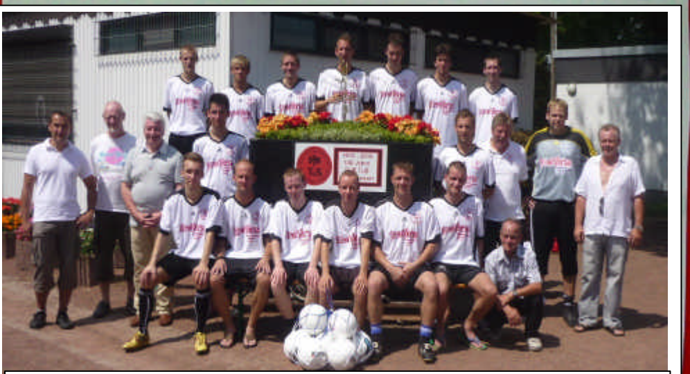
1. Mannschaft im Jubiläumsjahr