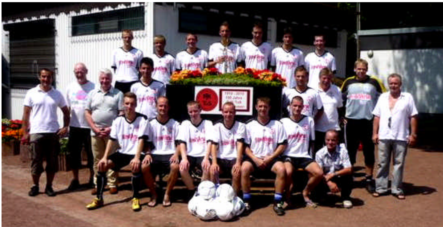
Erste Mannschaft mit einigen Sponsoren des Vereins...und dem Gegner vom gestrigen Sonntag vor dem Spiel "Auf der Reihe". Mit 5:1 wurde Blau Gelb Überraschungsbesiegt.