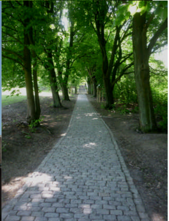
Links: Am Himmel das Schachtzeichen im Ort zu sehen. . Rechts: Damals schon Ausflugs- und Naherholungsgebiet der Rotthausener Bürger. Der Mechtenberg (80 Meter) mit ganz neu ausgebautem Anstieg zum Bismarckturm.