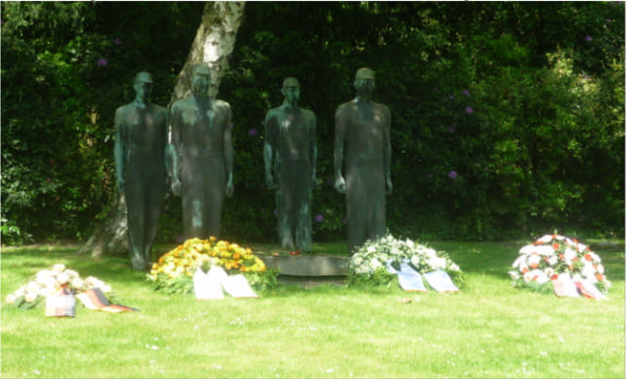
Das Denkmal auf dem Rotthaus Friedhof.

Das Unglück welches die meisten Opfer forderte liegt 60 Jahre zurück. 77 tote Bergleute waren am 20. Mai 1950 dabei umgekommen.