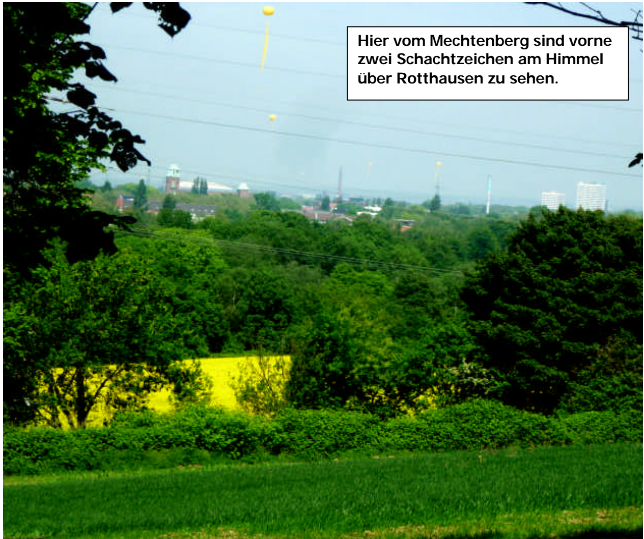
Hier vom Mechtenberg sind vorne zwei Schachtzeichen am Himmel über Rotthausen zu sehen.