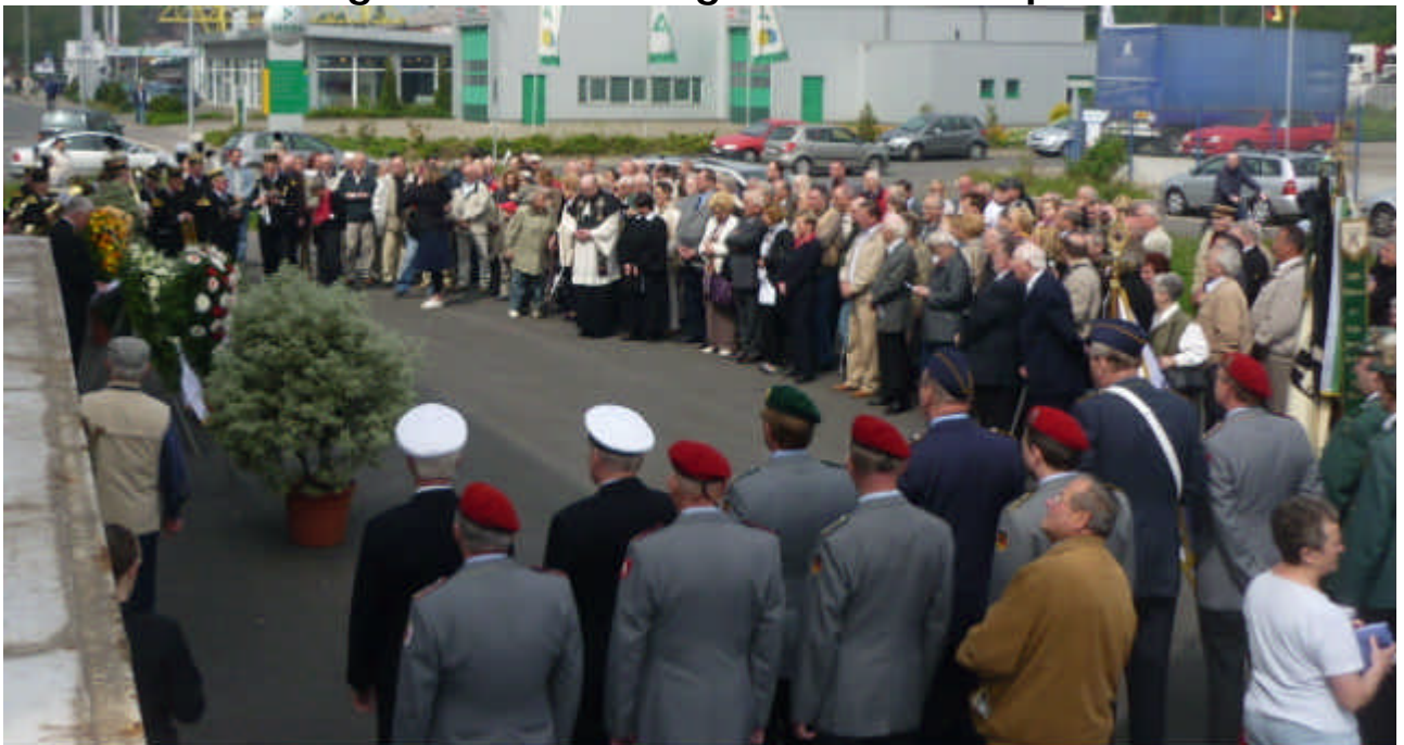
... vor über 200 Gästen und teilnehmenden Rotthausener Bürgern, ließ es sich nicht nehmen auch auf die dunklen Stunden der Zeche Dahlbusch hinzuweisen in denen bei durch Schlagende Wetter viel Verunglückte zu beklagen waren.