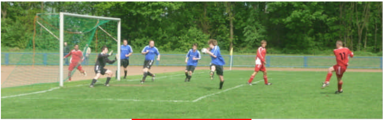
Der Ball sitzt ..oder ?