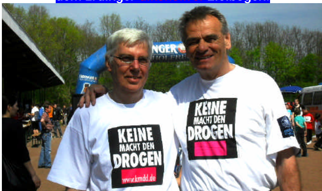
769 gemeldete Starter beim letzten Volkslauf.