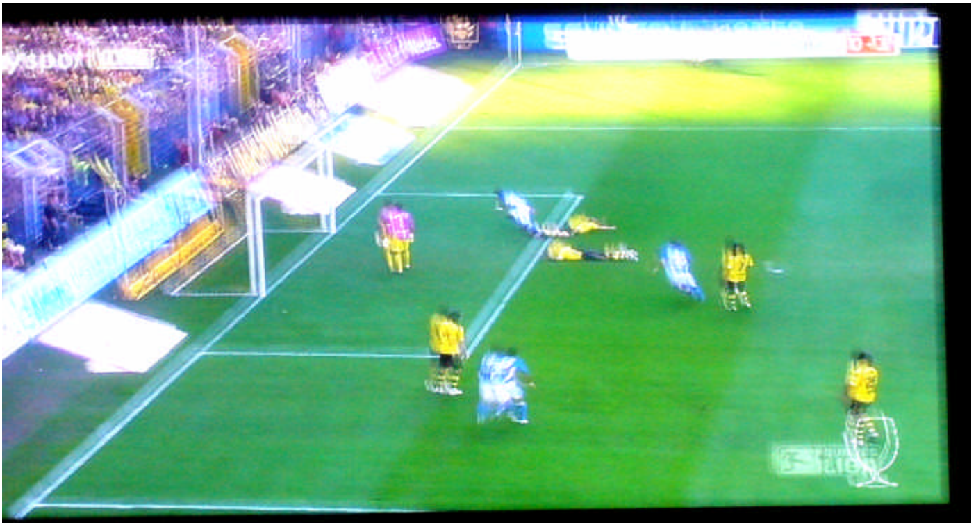
Goldenes Tor gegen Borussia Dortmund reicht zum Sieg für den FC Schalke 04