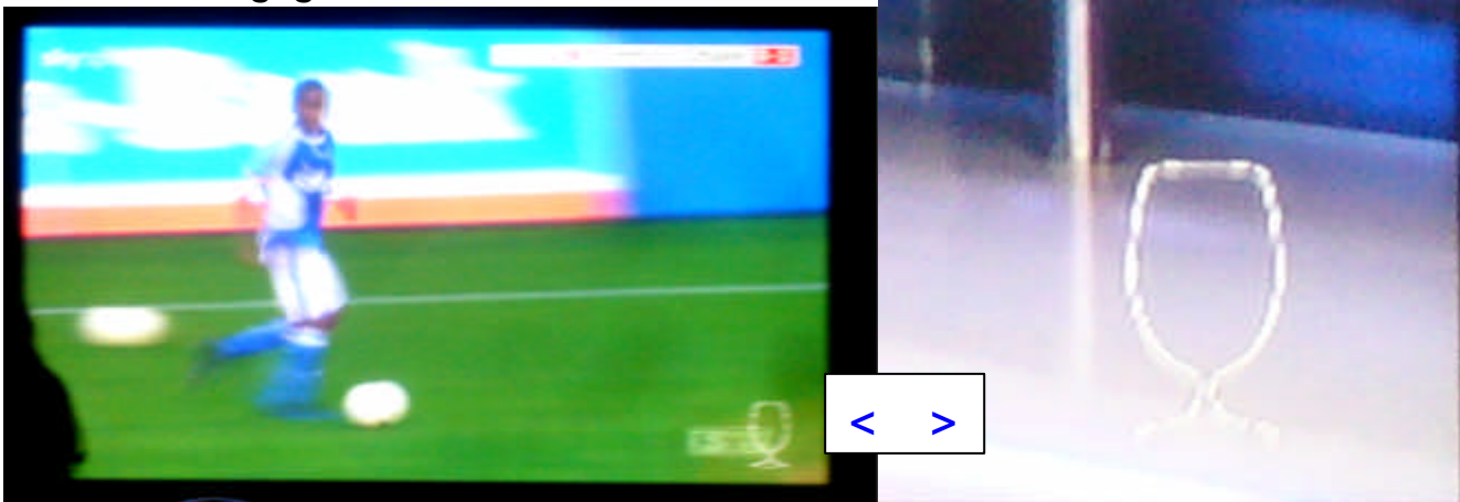
Farfan hat auch in den letzten Sekunden des Spiels den Ball am Fuß. Das war sein Tag. Das Bierglas rechts im Bild ist das Erkennungszeichen einer öffentlich von Sky gestatteten Bundesligaspielübertragung. Nur mit diesem Zeichen ist es legal.

Das Derby in Erle lässt 19 nach 50 Jahren gegen 08 im M-Spiel aufeinander treffen. Die Veilchen waren die Besseren und gewannen vor 500 Zuschauern mit 3:0. Erle 08 hatte im letzten Spielabschnitt, das Pech, den möglichen Ehrentreffer durch einen Pfostenschuss zu verbaseln. Nachfolgend einige Szenen vom Forsthaus