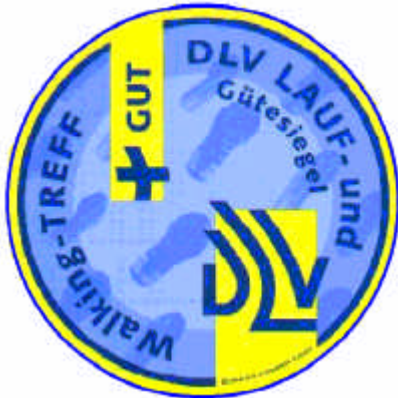
Altes Gütesiegel – GUT