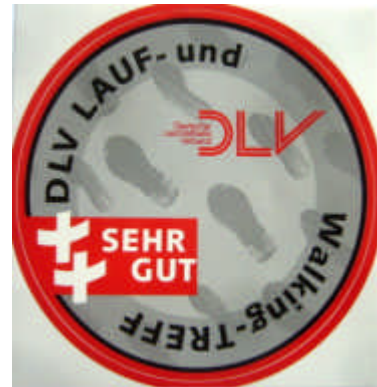
Neues Gütesiegel – SEHR GUT

Nach dem Schriftverkehr mit Dr. Feil, dem Ernährungsberater des Fußball-Bundesligisten VfR Hoffenheim keimt für alle Fußballamateure Hoffnung auf. Eine Verbesserung des eigenen Fußballspiels, um den Abstand zu den Profis nicht zu groß werden zu lassen, besteht neben regelmäßigem Training nur in einer gezielteren Ernährung. Hier der Link zu seinem E-Book im Internet unter