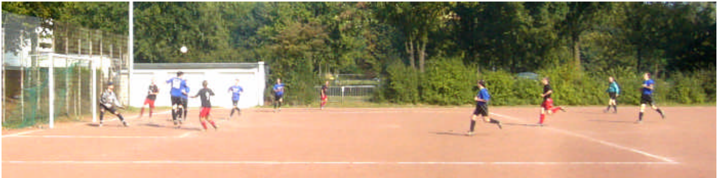
Sutums Abwehr kommt nicht an den Ball