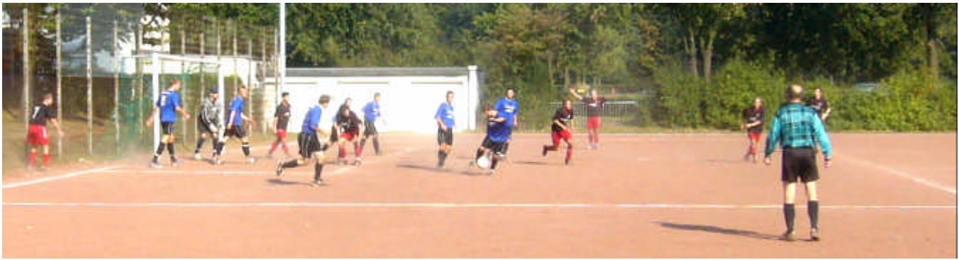
Sutum kann hier noch klären!