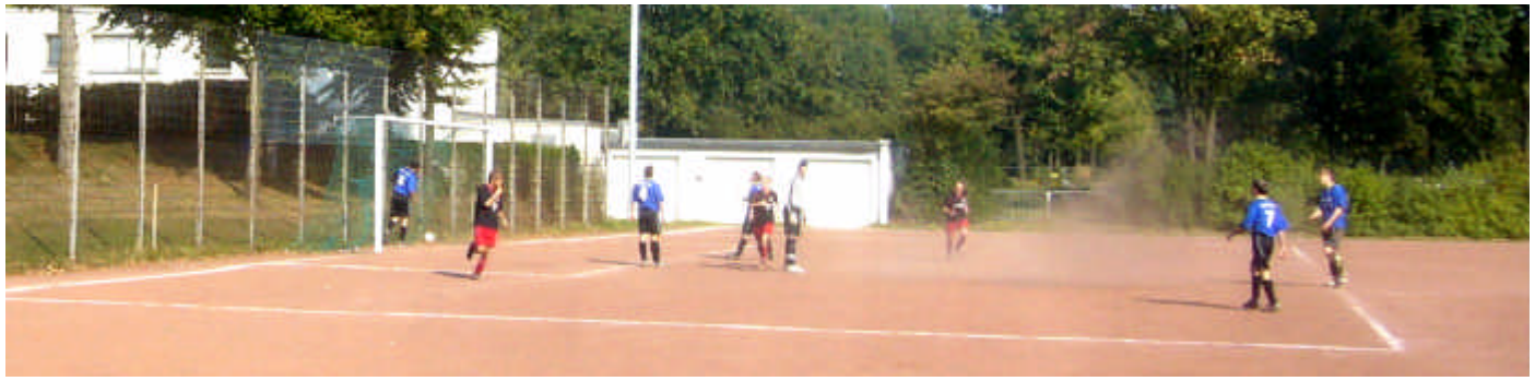
Den Hausherren bleibt nur, das Leder aus dem Kasten zu holen.