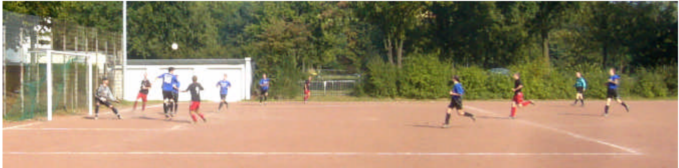
Nächste Flanke von der rechten Seite.....