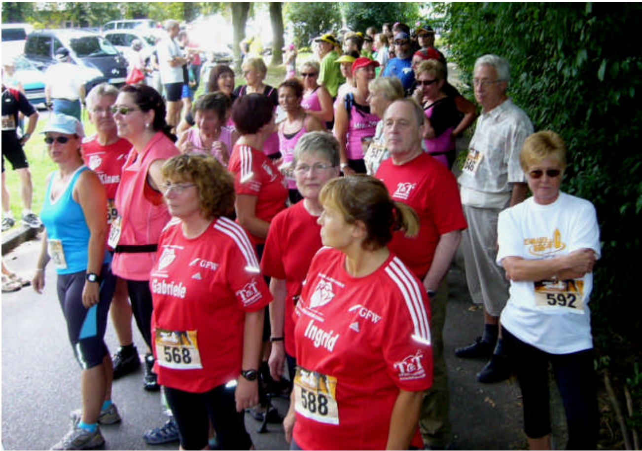
Warten auf den Startschuss