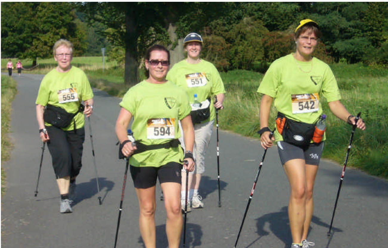
Nordicspaß beim Kemnader Burglauf.... Salvatores Wettkampferbericht aller DJK TuS Teilnehmer mit Zeiten und Details folgt in Kürze.....