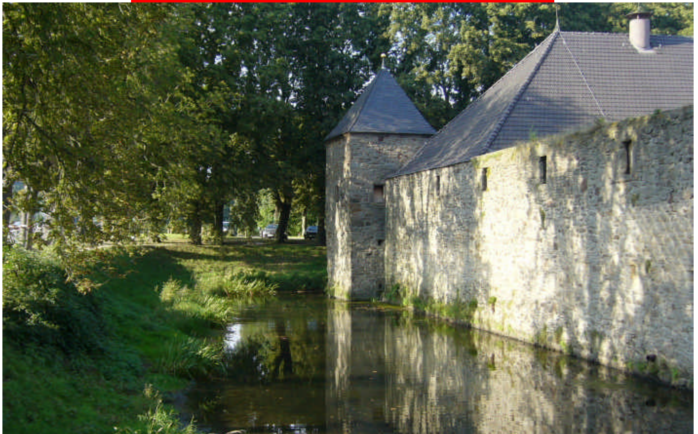
Blick auf das Wasserschloss Burg Kemnade an der Ruhr. Während einer Laufpause konnte man sich im Museum des Wasserschlosses umsehen..... aber auch sonst wurde für alle Teilnehmer viel Kurzweil zwischen den einzelnen Starts geboten.