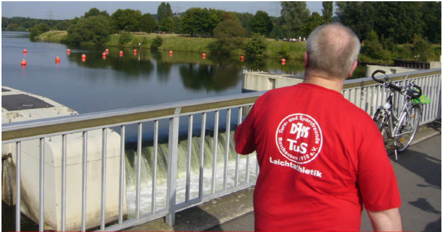
Eine beschauliche Strecke rund um den Kemnader Stausee in Bochum an der Ruhr.