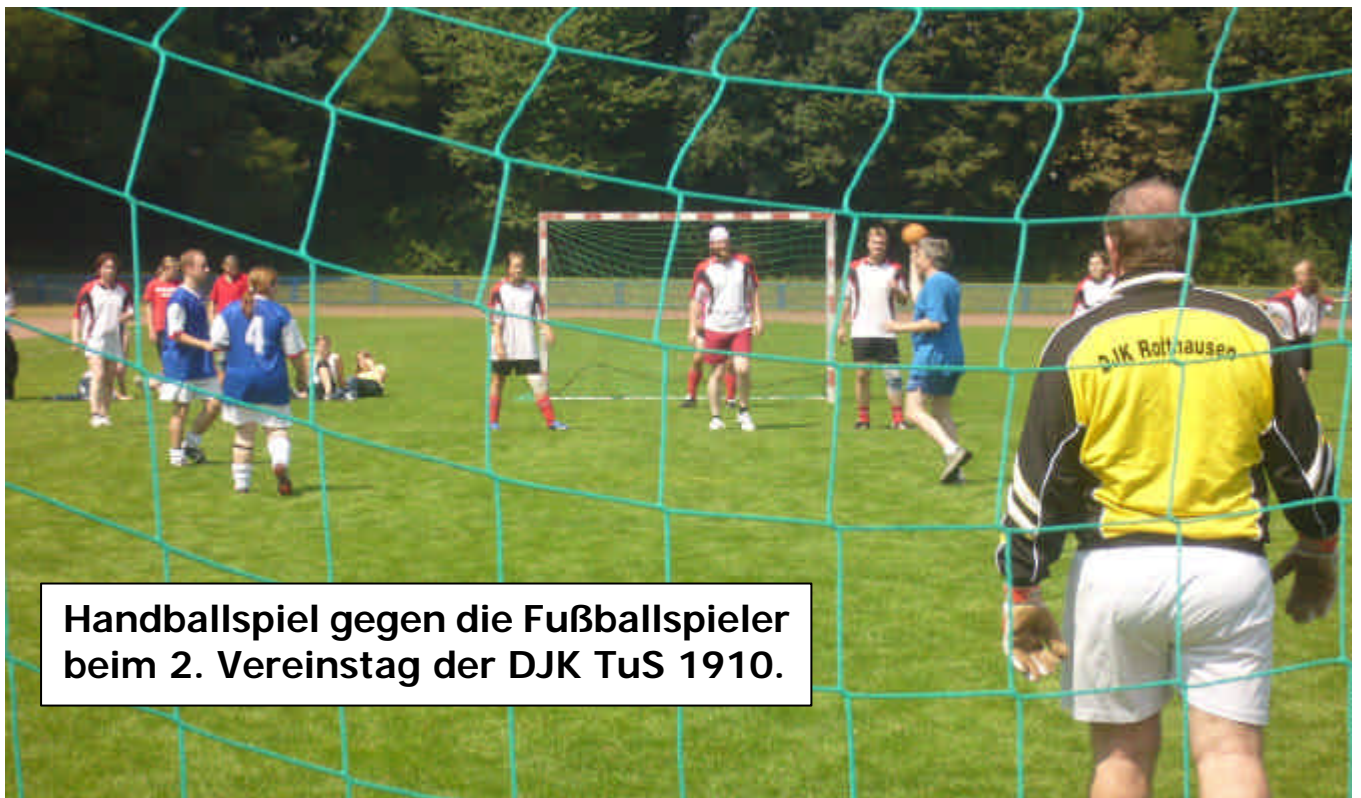
Handballspiel gegen die Fußballspieler beim 2. Vereinstag der DJK TuS 1910.