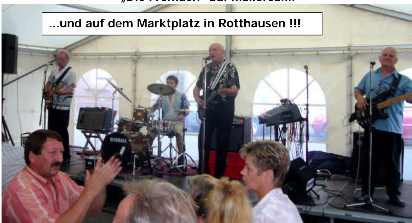
...und auf dem Marktplatz in Rotthausen !!!

„Die Fremden“ eine Rockband – für Insider eine der besten Bands die Musik der 50er und 60er Jahre nachempfinden und produzieren können – spielten am Wochenende auf Einladung der Orts- CDU in Gelsenkirchen-Rotthausen. Auf dem Marktplatz im Rahmen des 3. Musikfestivals feierten sie wie immer wo sie auch auftreten so auch in Rotthausen große Erfolge. Auf dem obigen Bild sind sie der Einladung des Gelsenkirchener Rolf Wagemann gefolgt und spielten in Cala d´Or vor einer großen Fangemeinde auf der beliebten Baleareninsel Mallorca. Im Rahmen der 20. Jazz-Tage sind sie natürlich auch wieder mit dabei. Die Rockfans stehen mit den Twist-Tänzern schon in den Startlöchern.