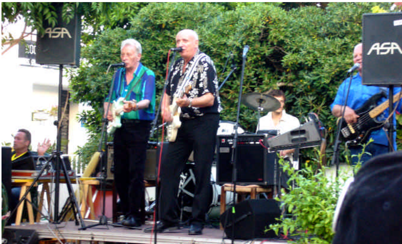
„Die Fremden“ auf Mallorca...