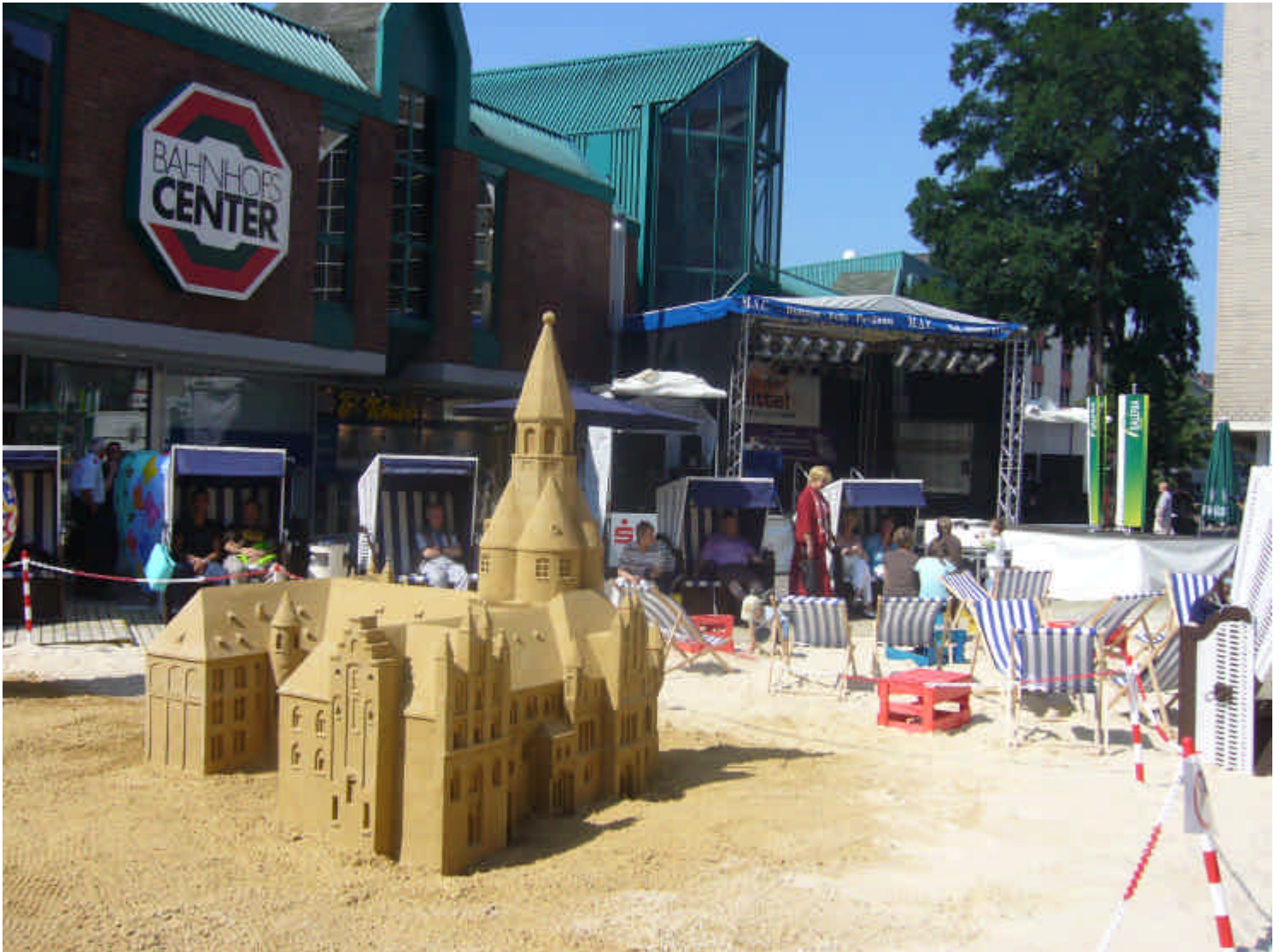
Nachbildung des Gelsenkirchener Rathauses vor dem Bahnhofcenter. Leider wurde das schicke Gebäude damals aus Kostengründen aufgegeben und abgerissen.

Aktueller FLE-Sport in Bildern natürlich auch unter www.gelsenkirchenmarathon.de