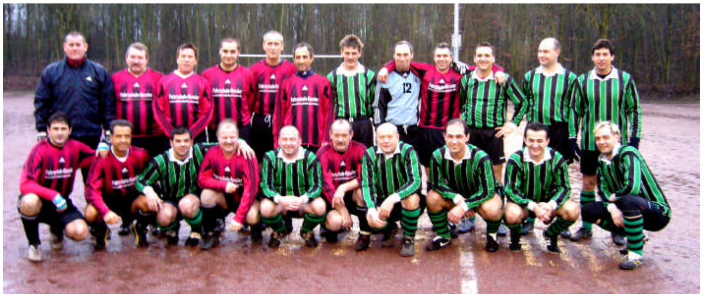
DJK TuS Altherren und Altligaspieler beim Neujahrsspiel im Januar 2007.