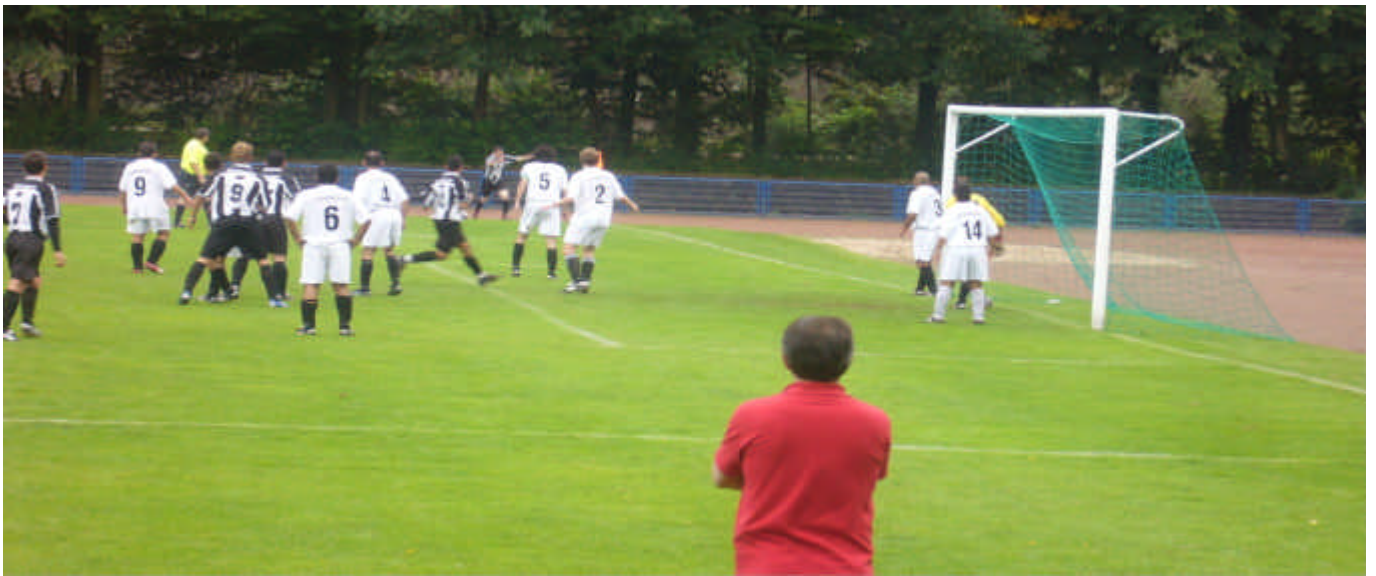
Hier eine Szene aus einem weiteren Spiel der Kreisliga A im Gelsenkirchener Südern. Auf dem Platz an der Gesamtschule Ückendorf standen sich DJK A. Ückendorf und EtuS Bismarck gegenüber. Endstand 3:3.