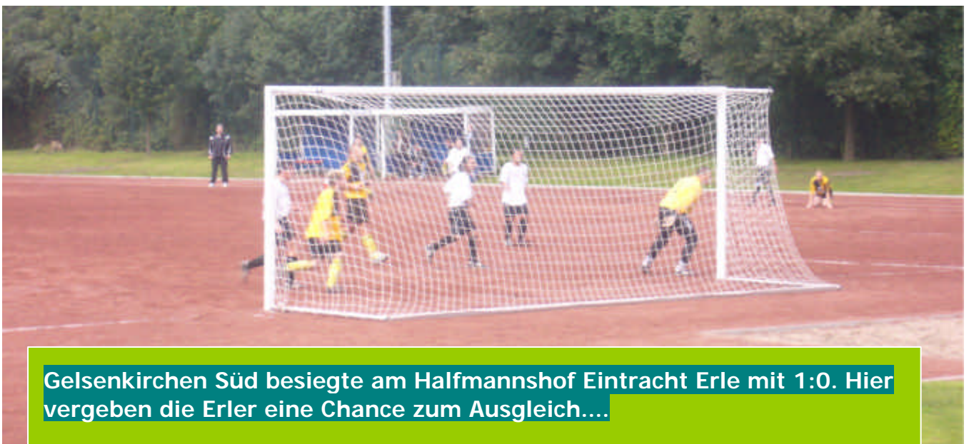
Gelsenkirchen Süd besiegte am Halfmannshof Eintracht Erle mit 1:0. Hier vergeben die Erler eine Chance zum Ausgleich....