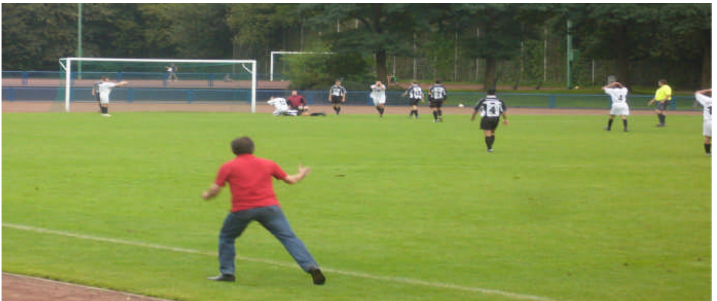
Der Bismarcker Trainer hadert mit seinem Mittelstürmer über eine vergebene Großchance zur erneuten Führung...