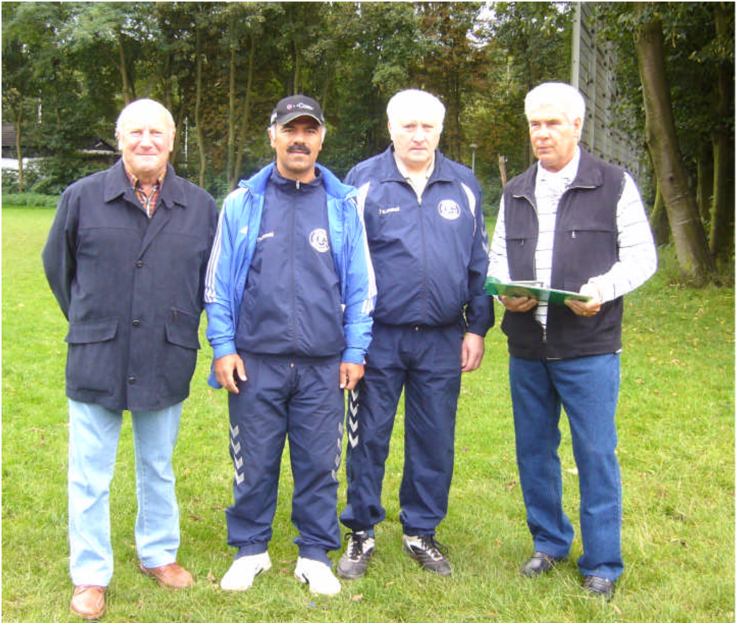
Die Führung von Sportfreunde 07/12 Gelsenkirchens Fußballabteilung begleiten ihre Mannschaft an einem jeden Sonntag und übernehmen die Betreuung der Spieler mit