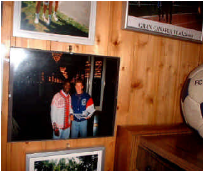
Hier im Bild mit Roger Mila bei einer Fußballgala in Bonn.