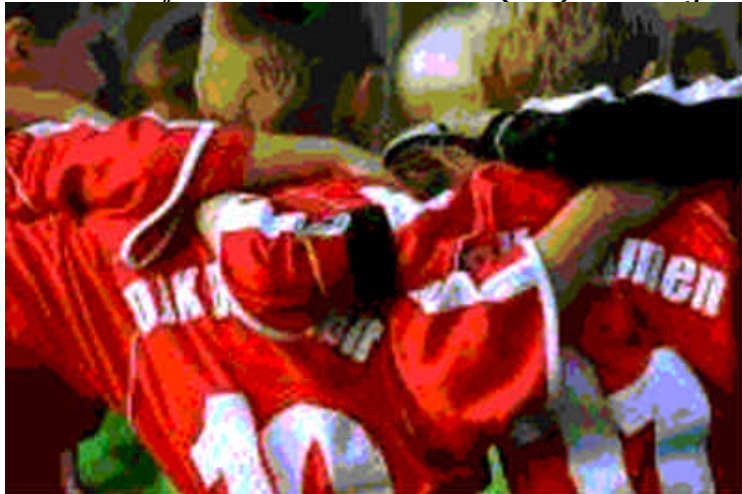
Sportorganisation des Landes.

Allerorts wurde gekickt, auch in den konfessionell geprägten Milieus wie den katholischen Jünglings- und Jungmännervereinigungen. Im September 1920 kam es zur Gründung der „Deutschen Jugendkraft“, dem Reichsverband für Leibesübungen in katholischen Vereinen. Bis zum Ende der Weimarer Republik entwickelte sich der Verband mit über 200.000 Mitgliedern neben der „Deutschen Turnerschaft“ und dem „Deutschen Fußballbund“ (DFB) zur drittgrößten