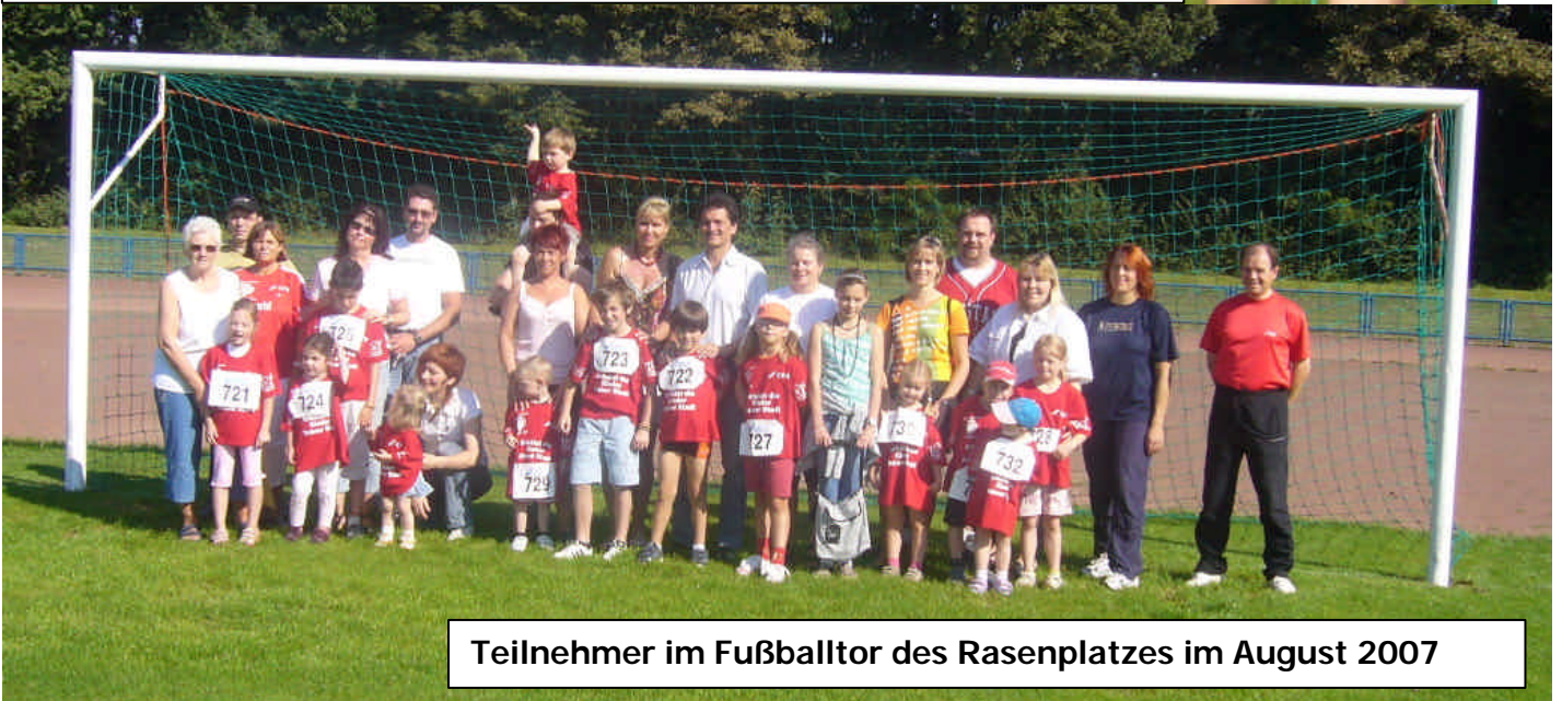
Teilnehmer im Fußballtor des Rasenplatzes im August 2007

Im Laufe des Familientages finden wieder Fußball- und Handballspiele über den ganzen Tag verteilt statt. Hier eine Szene aus dem Handballspiel einer gemischten Mannschaft vom Familientag des vergangenen Jahres. Sportliche Kurzweil mit Sportspielen aller Art aus allen Sportabteilungen der DJK TuS 1910 werden also wieder an diesem Tage für alle durchgeführt . Mit Grillstand und Cafeteria wird auch für's leibliche Wohl zu volkstümlichen Preisen gesorgt.