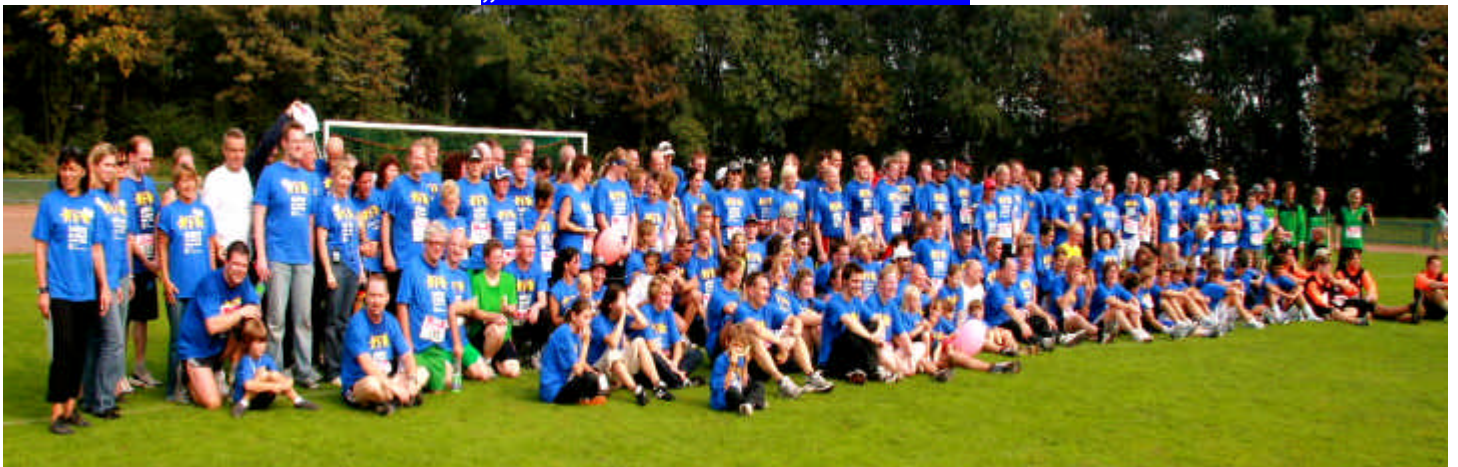
Fast das gesamte Starterfeld nach dem Zieleinlauf auf einem Bild