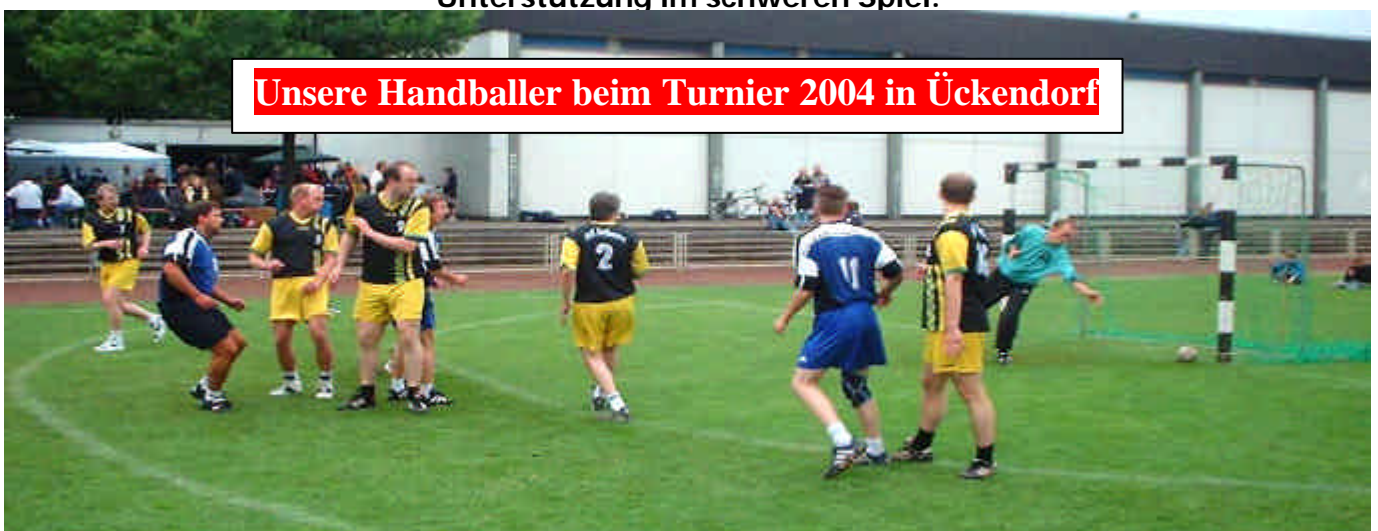
Unsere Handballer beim Turnier 2004 in Ückendorf

.....sieht auch unsere Handballabteilung durch Pokalglück im Focus. Am Donnerstag den 25. Januar 2007 spielt unsere 1. Handball-Herren gegen Westfalia Herne. Eine um 7 Klassen höher angesiedelte Mannschaft . Anwurf der Partie in der Halle Schulzentrum Ückendorf an der Bochumer Straße ist um 20:00 h. Wer also einem Handballspiel mit unserer DJK TuS Beteiligung live beiwohnen möchte hat dazu eine gute Gelegenheit. Unsere Männer freuen sich auf jede Unterstützung im schweren Spiel.