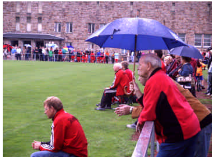
„Eine starke Bank“ gibt unserem Team Rückhalt. Gut gefüllte Zuschauerränge in der „Glückauf-Kampfbahn“. Im Hintergrund die denkmalgeschützte Tribüne.