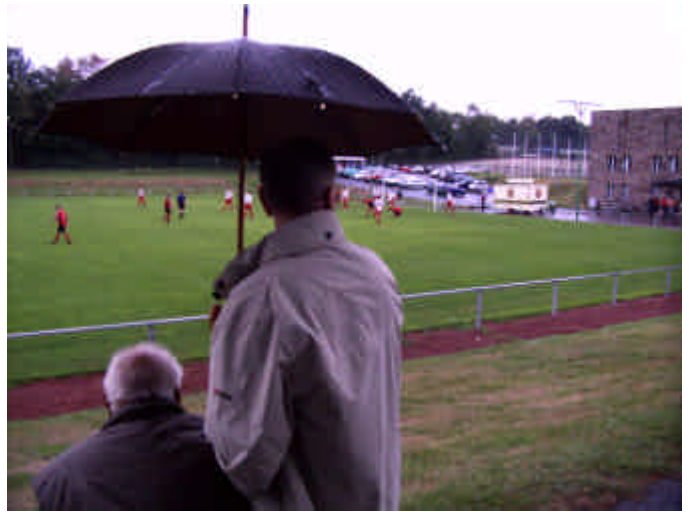
Trotz heftigen Regens waren unsere Zuschauer zufrieden.