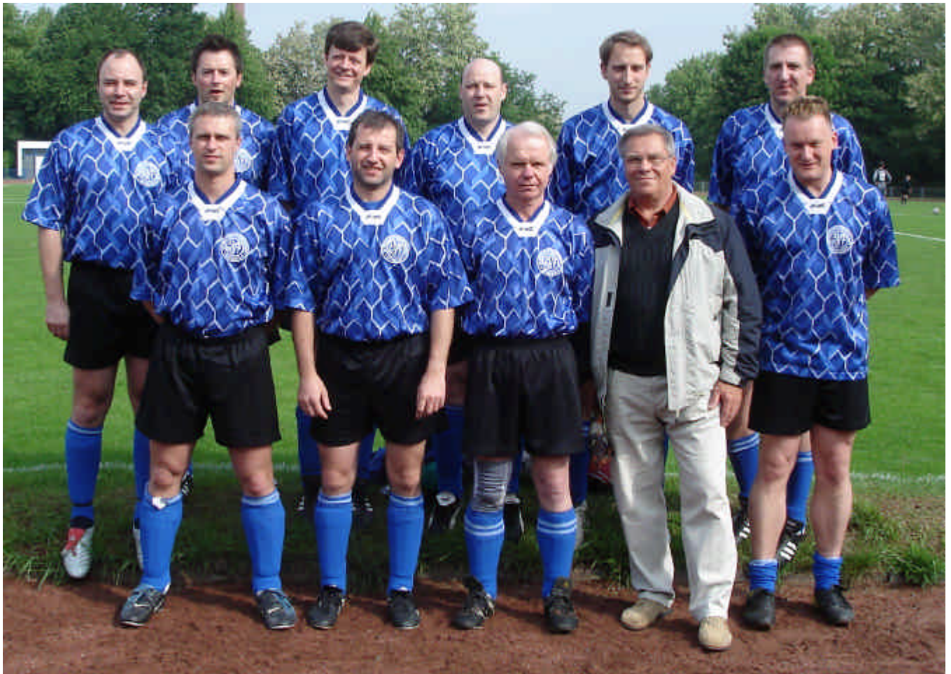
Die Mannschaft des Turniersiegers aus Bayreuth

Ein Pluspunkt beim Fußballturnier war der Bierstand, der Zuflucht vor dem Regen bot.