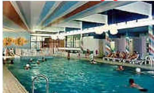
Soleaußenbecken des Revierparks Nienhausen und Hallenbad mit 26 ° warmen Wasser