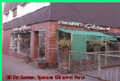
GfW Gelsenkirchen, Sponsor: Alfred Verse

Noch 185 Tage bis zum Beginn des großen Fußballfestes, der FIFA WM 2006, in unserer Stadt Gelsenkirchen.