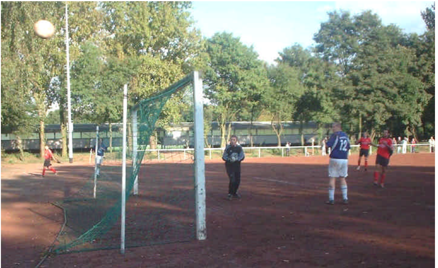
Die andere Situation erzwang unser Stürmer Emin, ganz rechts im Bild der den Ball lieber im Winkel des gegnerischen Tores gesehen hätte. Doch auch dieser Versuch ging am Tor vorbei.