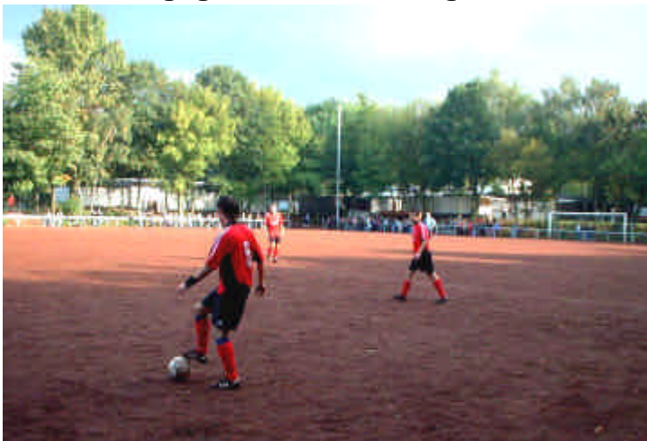
Hendann und Krahe beim Spielaufbau. Stören und aufbauen gelang beiden heute ganz gut.