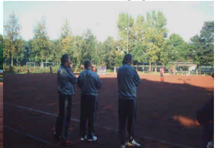
Konnten die Niederlage nicht abwenden: Das Erler Führungstrio am Spielfeldrand.